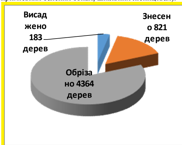
Рис.1. З цієї діаграми чітко видно що кількість вирубаних дерев за насаджени в 4,5 рази більша, тобто на 638 дерев більше зрубано ніж посаджено