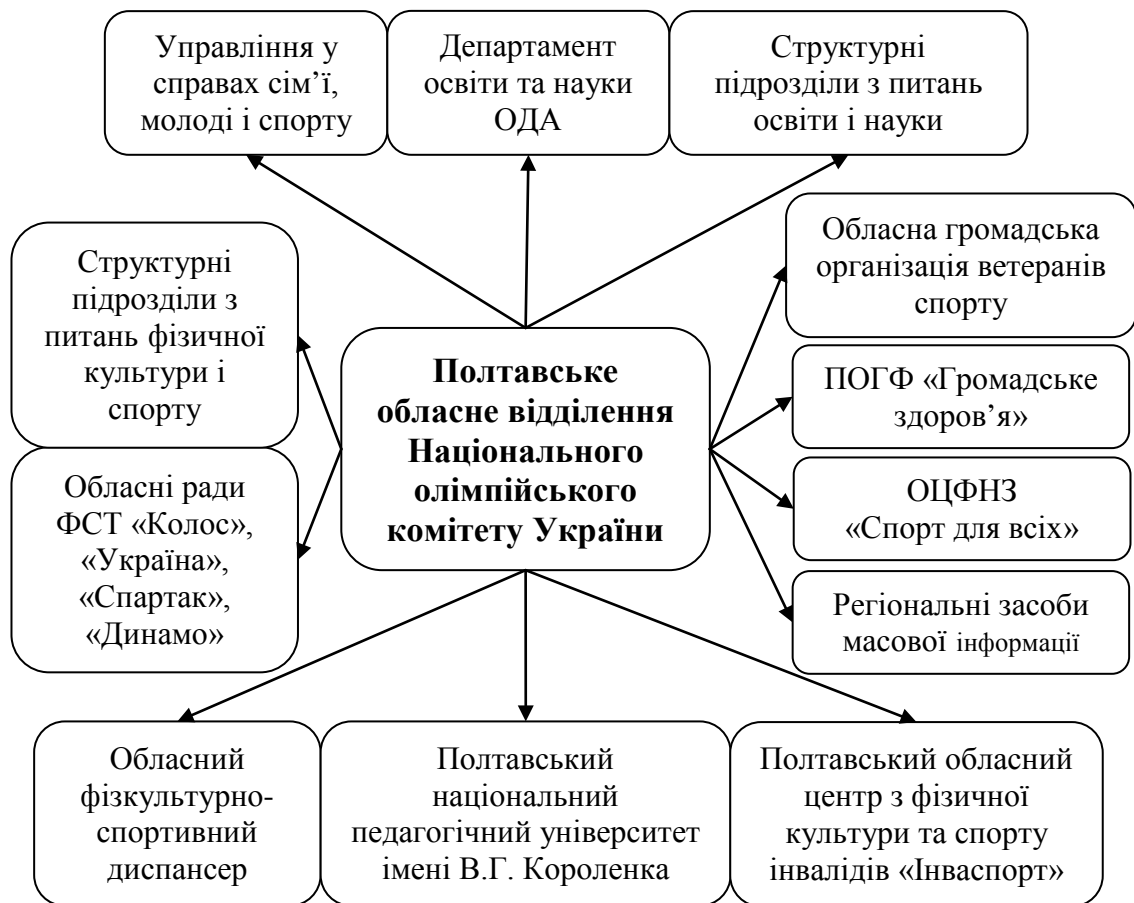
Рис. 2. Співпраця ПОВ НОК України з державними та громадськими організаціями, фондами, установами

Полтавське обласне відділення Національного олімпійського комітету України тісно співпрацює з Полтавським національним педагогічним університетом імені В.Г. Короленка (угода про співпрацю від 6 березня 2017 року) з метою популяризації олімпійського руху та ідей щодо здоров'язбережування серед науково-педагогічних працівників та особистостей майбутніх учителів. Так, на базі факультету фізичного виховання створено Полтавське обласне відділення Олімпійської академії України (витяг з протоколу № 3 вченої ради факультету фізичного виховання Полтавського національного педагогічного університету імені В.Г. Короленка від 14 листопада 2016 року).