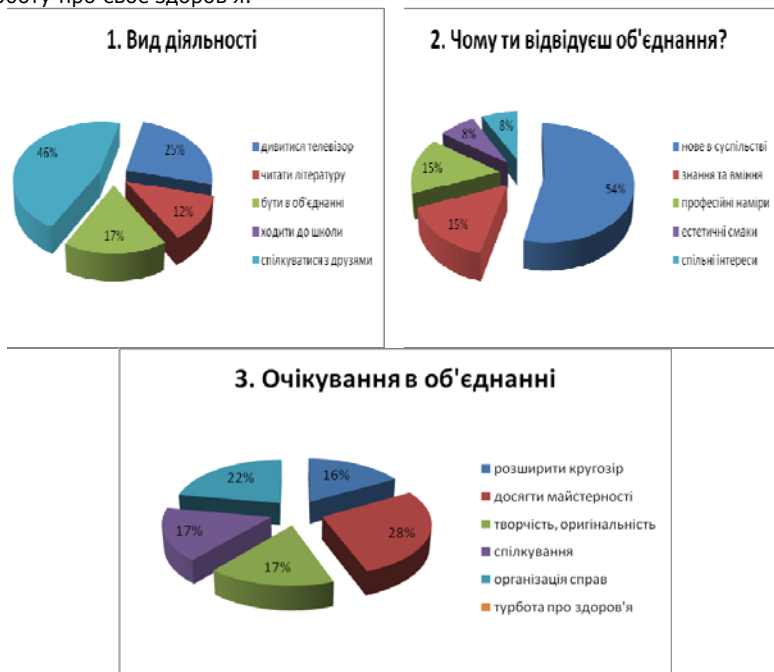
Рис. 1 Діаграми результатів дослідження за методикою Н.Сас

розширити кругозір, якомога більше пізнати з обраної діяльності; досягти майстерності, високого рівня виконання обраної справи; виявляти творчість, оригінальність, неповторність під час підготовки і проведення загальногурткових справ; спілкуватися з новими друзями; брати участь в організації і проведенні загальногрупових справ на радість і користь оточуючим; виявляти турботу про своє здоров'я.