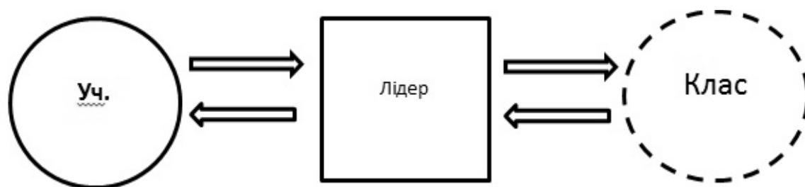
Схема 1. Лідерсько-опосередкована взаємодія вчителя з класом

1-ша конфігурація. Тип «Лідерсько-опосередкована взаємодія». Учитель – позитивний лідер класу – клас (див. схему 1).