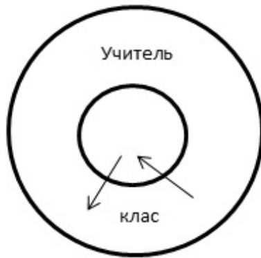
Схема 2. Пряме спілкування «вчитель – клас»

Безпосередній вплив учителя і безпосередні послання до всіх учнів. Учитель і учні – створюють підсистему, відокремлену границею від інших учасників системи – адміністрацією, колегами-учителями, батьками учнів. Даний тип – це пряме, безпосереднє спілкування.