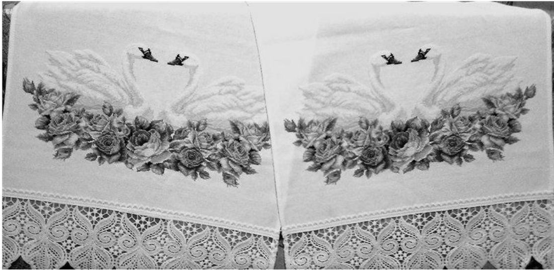
Рис. 5. Символ родинного щастя на весільному рушнику Свириденко В.М. Полотно, хрестик

Майстрині свідомо урізноманітнюють орнаментальні мотиви, адже основне їхнє завдання – створити емоційний образ, символ родинного щастя, взаємного кохання.