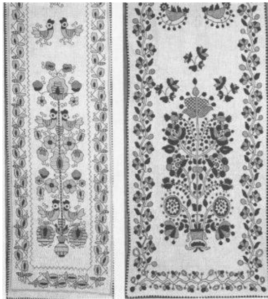
Рис.2. Рушники «Древо життя» середина ХХ століття Полотно, рушниковий шов.

Древо життя з квітами, листям барвінку, дубовими, березовими листочками. Вони віщували молодому подружжю народження міцних дітей: хлопчиків і дівчаток та продовження родоводу. Обов'язкова присутність вгорі обабіч Древа пари птахів, повернутих дзьобиками один до одного (рис.2).