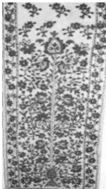
Рис 3. Весільний рушник. Зіньків, Полтавщина. Кінець ХІХ – початок ХХ століття

З країв весільного рушника – колосся, щоб життя було з хлібом і колосилося. Два вишиті кінці об'єднувало чисте поле. Вишивала їх дівчина-наречена у Великий піст, коли душа очищається від гріха, а тіло від зайвої ваги. Рушник має два крила, як поєднання двох протилежностей, двох доль – чоловічої та жіночої. Символи росту і благодаті, на весільному рушнику, покликані благословити і захистити це поєднання (рис.3).