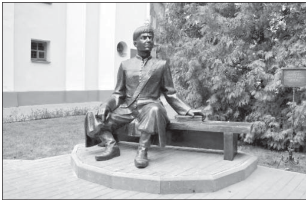
Пам'ятник Першому спудеві Східної Європи на подвір'ї Острозької академії

Ця ікона на початку XVIII ст. писалася як ікона святого Стефана і зберігалася в палаці князів Сангушків у місті Славуті. Чомусь вона не сподобалася князеві, тому полотно згори скрутили, а нижче заґрунтували й написали образ Ісуса Христа. І висіла ікона Спасителя в палаці