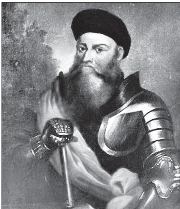
Князь Костянтин Острозький – найкращий воєначальник свого часу

Ярослав Дзісяк слушно зауважує, що ніколи до цього московське військо не зазнавало такої нищівної поразки. Майже через 150 років те саме говоритимуть про битву під Конотопом. «Але якщо остання є добре вивченою і висвітленою в українській історіографії, то битва 1514 р. – маловідома. Проте якщо перемога під Конотопом все ж не врятувала України (Великого князівства Руського) і самого гетьмана Виговського, то перемога над московською армією Великого гетьмана Острозького під Оршею стала певною межею, яка означила кінець довгого просування Московії на захід – на подальше загарбання українських земель. Однією з причин була відсутність на початку XVI ст. потужних ворогуючих політичних груп в українському