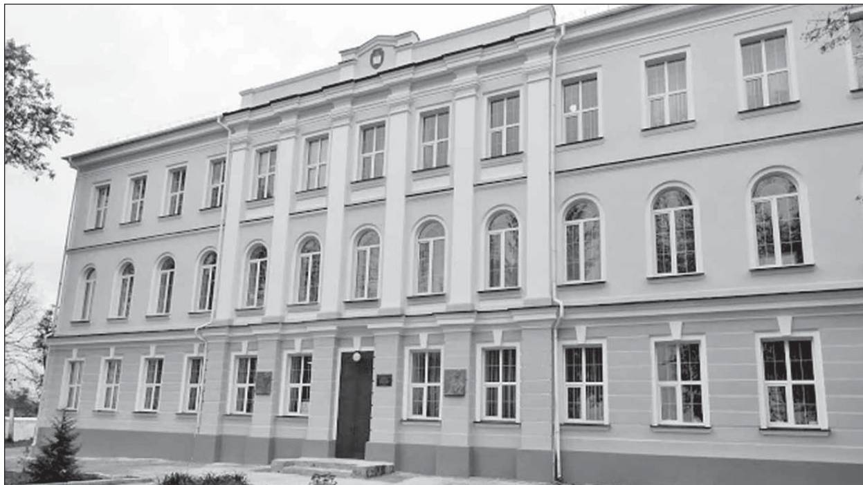
Гімназія в Острозі