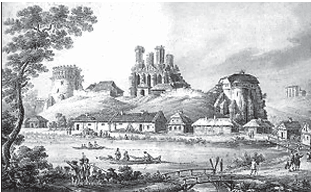
Зигмунт Фогель. Острозький замок

Тодішня геополітична ситуація до болю нагадує сьогоднішні торги Заходу з Путіним. Австрійський цісар Максиміліан I запропонував московському цареві Василю III забрати в Польщі частину українських земель. Цар за-