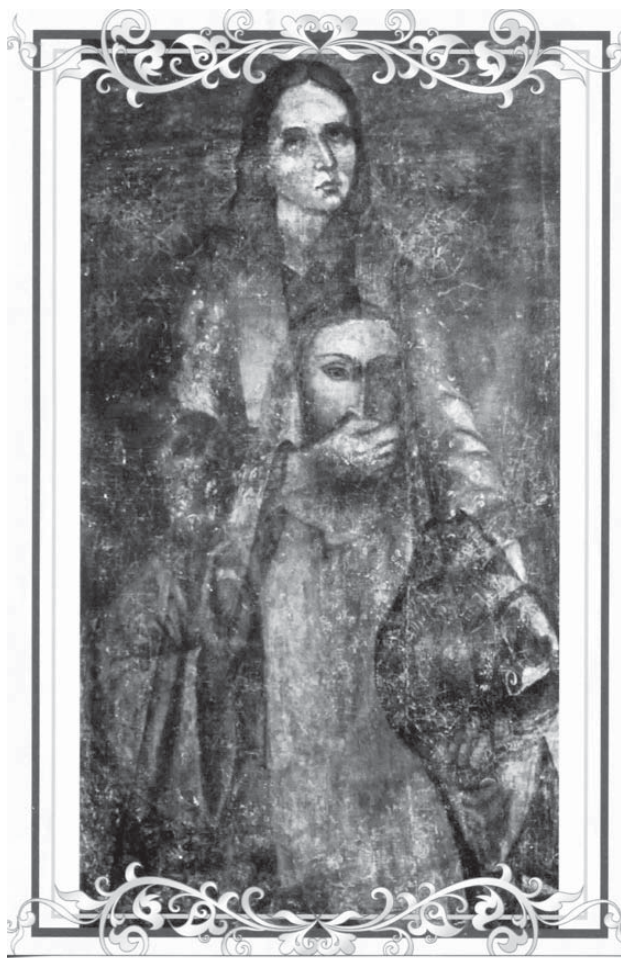
Ікона «Ісус Христос-Пантократор і Св. Стефан». Перша половина XVIII ст.

Побачили й ми таких усміхнених святих – Дмитрія Солунського і Єзекіїля та Сафонія. А між їхніми ясними ликами – найбільше диво цього храму: ікону, на якій святий Стефан закриває рукою вуста Ісуса Христа.