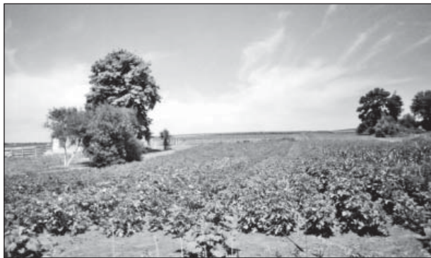
На цьому місці (на узвишші біля залишків липового гаю, що праворуч) стояла Денисівська початкова школа і мешкали вчителі