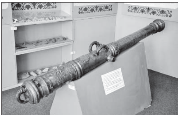
Якби-то всі гармати у світі були декоративними, як білогірська!..