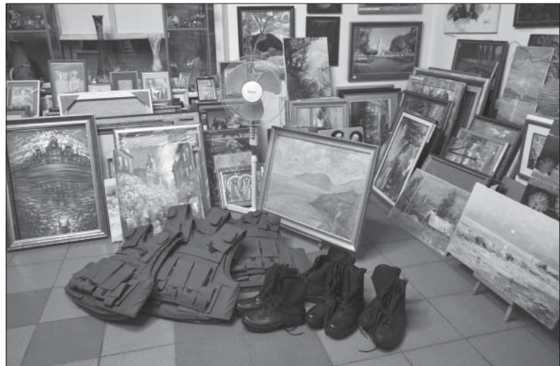
Допомога художників українським воїнам. Галерея «Арта». 2014 р.

виставку-продаж картин на підтримку української армії та національної гвардії. За «Українською весною» прийшли «Українське літо» і «Українська осінь», які стали реальною допо-