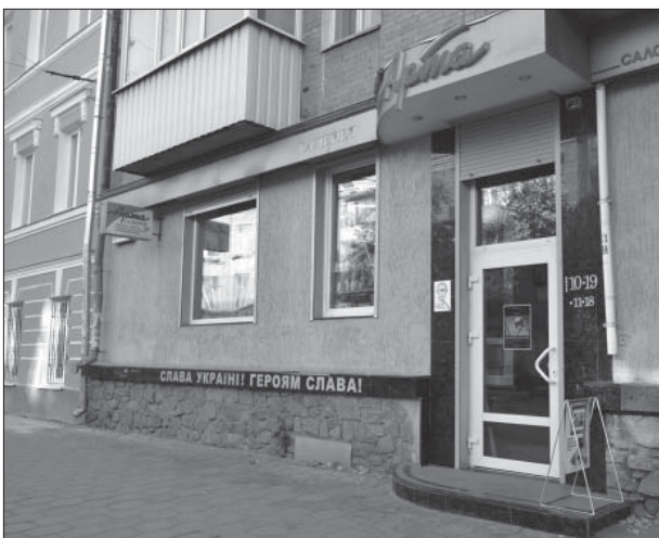
Галерея «Арта». 2014 р.

Зараз «Арти» понад десять років, її добре знають і люблять у Полтаві. А відкриття виста-