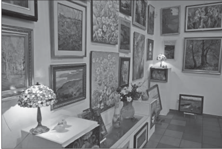
Благодійна виставка «Українська весна» на підтримку української армії. Галерея «Арта». 2014 р.

вок завжди є справжнім живописним святом. «Божевільна ідея» Петушинських утілилася в життя міста, перетворилася на острівець творчості, мистецьку паузу серед хаосу буденності. Галерея вистояла в складні роки, не зрадила мистецької ідеї, загартувала коло однодумців, створила власний стиль виставок і спілкувань.