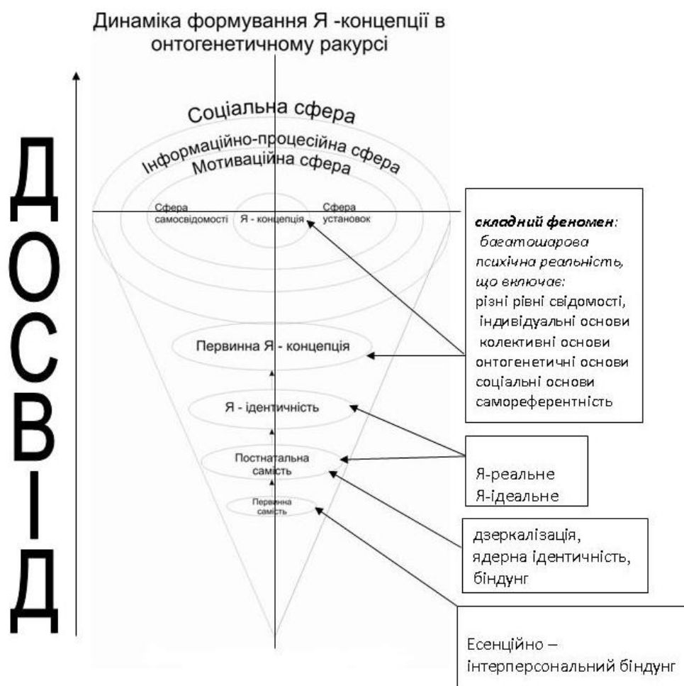
Рис. 1. Динамічна модель формування Я-концепції в онтогенетичному ракурсі

Обґрунтовано те, що якість ранньої прив'язаності між мамою та немовлям, задоволення базових дитячих его-потреб у дзеркалізації, ідеалізації (впевненості у всемогутності матері) та альтер-его (відчуття схожості з матір'ю), творить основу для формування первинного Я-образу та ядрової ідентичності та в подальшому Я-концепції (а їх порушення спричиняє порушення психічної інтеграції, що проявляється насамперед у нарцисичній психопатології) [9], [14], [15], [17].