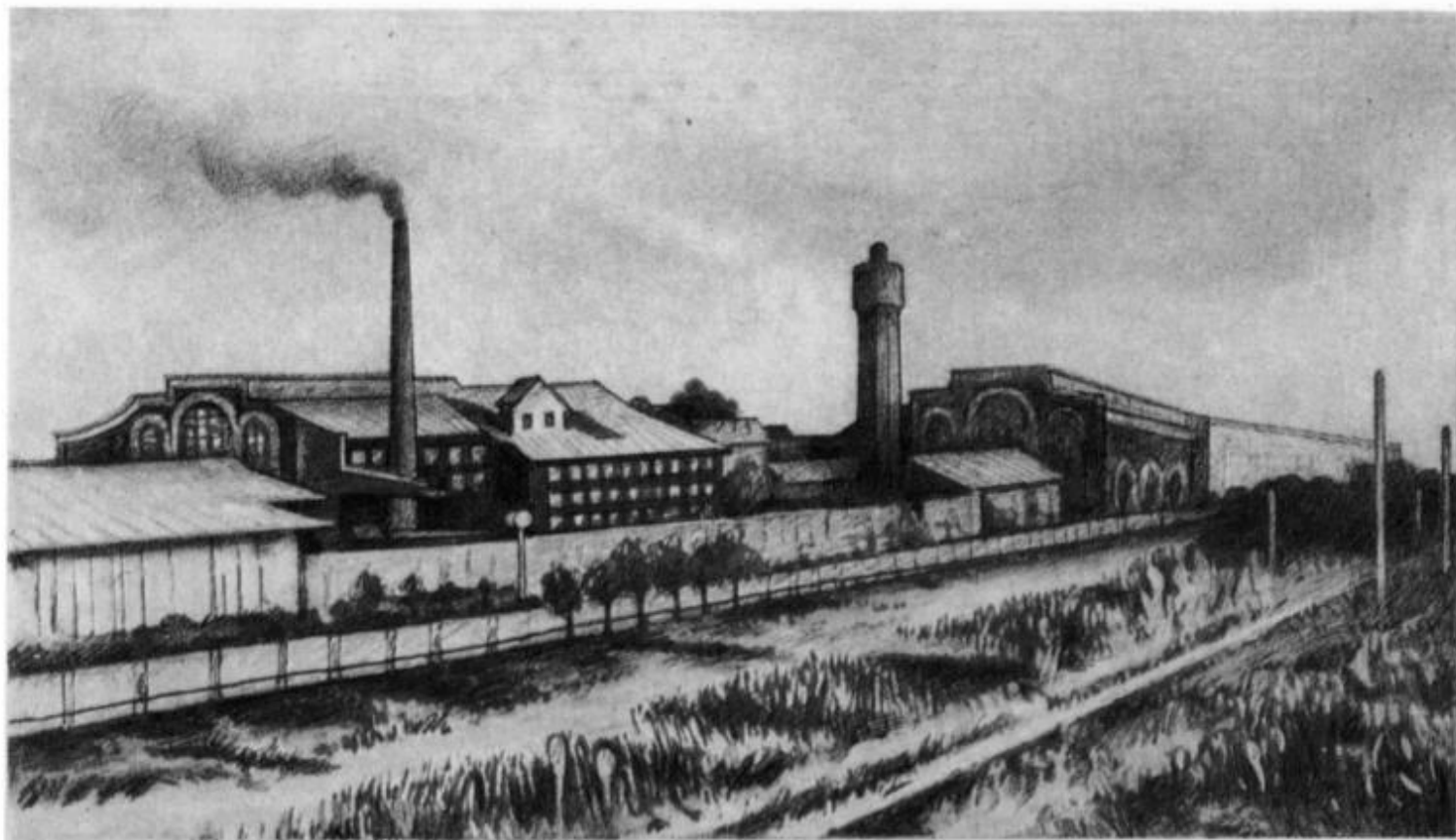
Крюковские вагонные мастерские, на территории которых располагалось Крюковское начальное училище (фото 1899 г.).