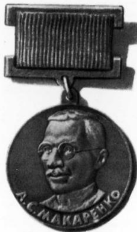
Медаль А. С. Макаренко, которой награждаются лучшие учителя Украинской ССР.