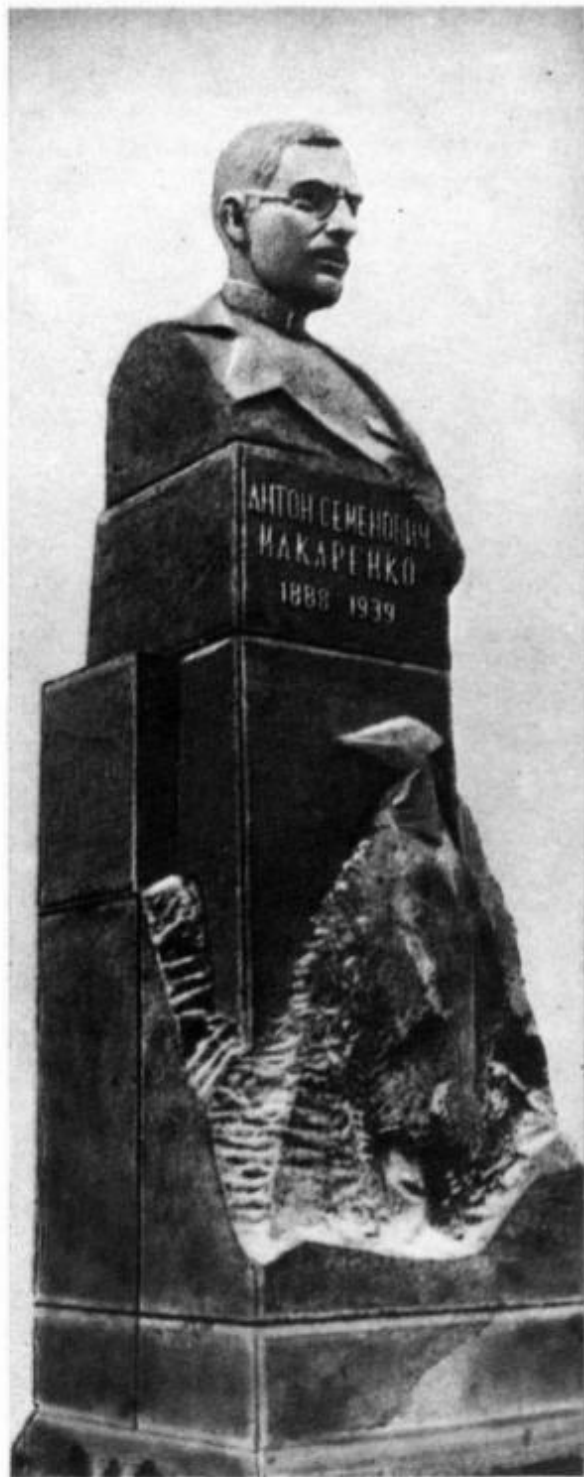
Памятник А. С. Макаренко в г. Харькове.