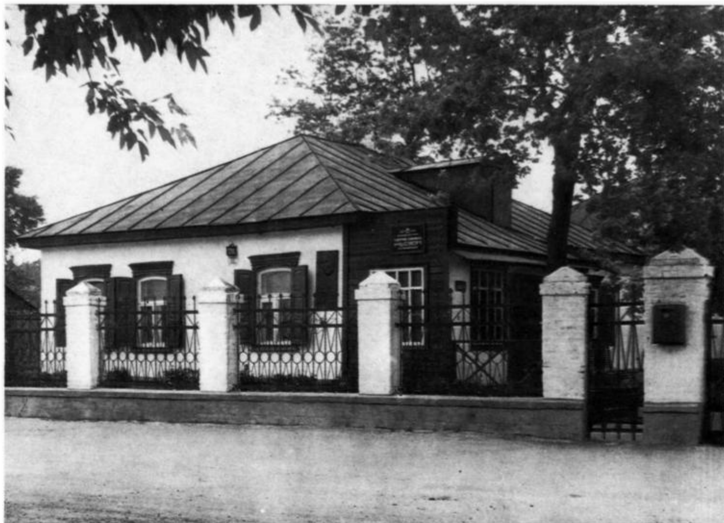
Здание Педагогическо - мемориального музея А. С. Макаренко в г. Кременчуге.