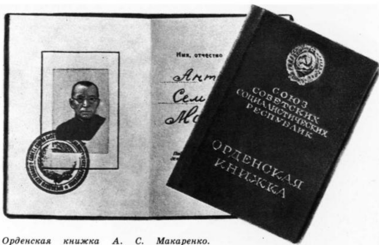
Орденская книжка А. С. Макаренко.