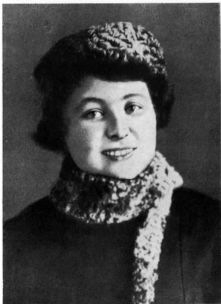
Г. С. Макаренко в молодые годы.