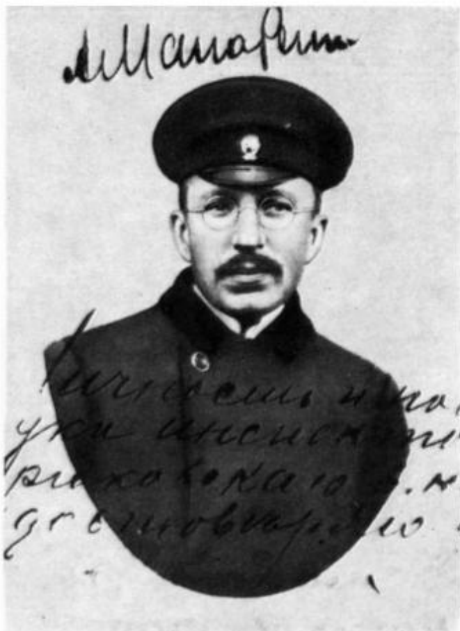
А. С. Макаренко — инспектор Крюковского высшего начального железнодорожного училища (1918—1919 гг.).