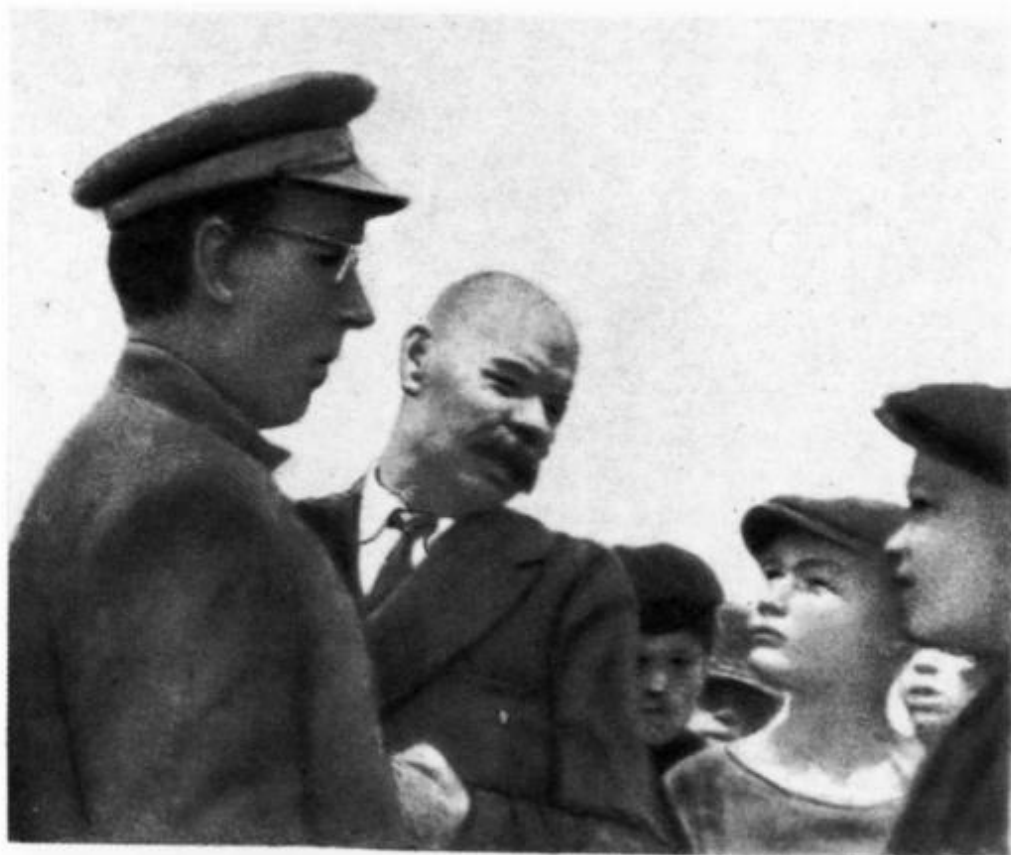
А. М. Горький в колонии. Слева — А. С. Макаренко (июль 1928 г.).

Первая страница письма А. С. Макаренко бывшему коммунару В. Г. Зайцеву (ныне журналист).