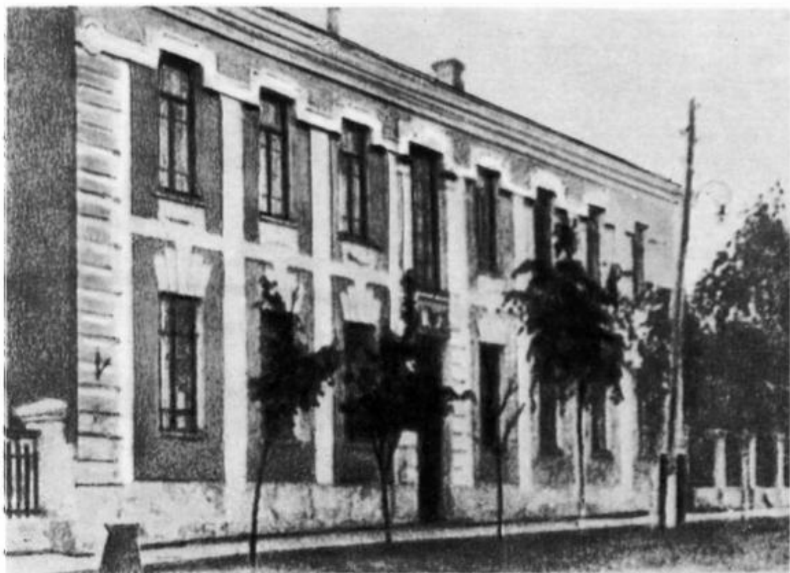
Здание Полтавского учительского института, в котором А. С. Макаренко учился в 1914—1917 гг.