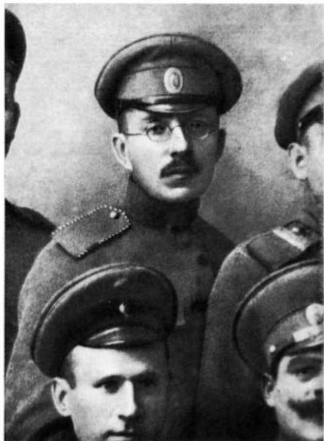
А. С. Макаренко в ополчении (конец 1916 г. — нач. 1917 г.).