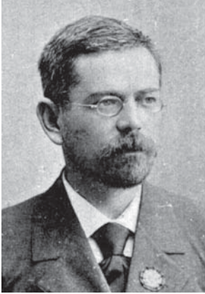
Д. І. Багалій – видатний український історик, організатор української науки та освіти, академік ВУАН