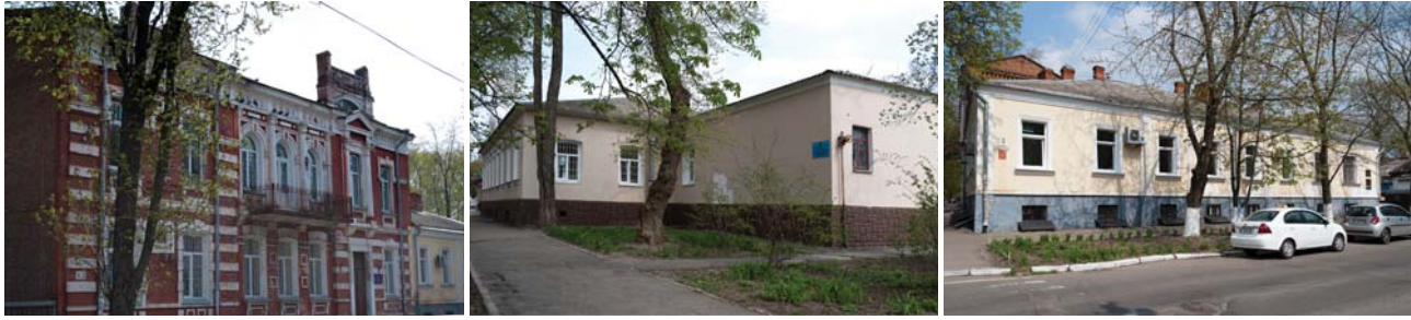
Будинки по вул. Новополтавській (нині Шевченка), 20 і Стрітенській (нині Комсомольська), 37 і 40 які у 1918-1921 рр. орендував Історико-філологічний факультет (сучасний вигляд)