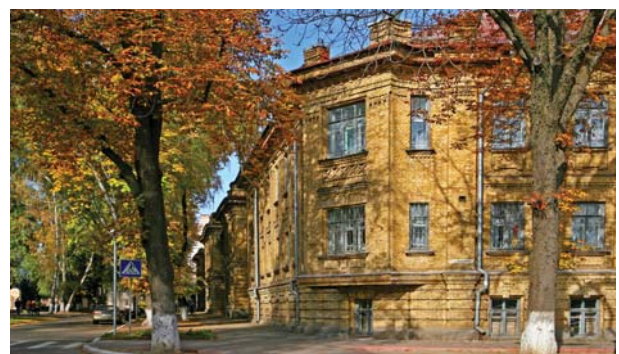
У 1955 р. завершилась відбудова навчального корпусу №1 по вул. Остроградського, 2, де зараз розміщується історичний факультет