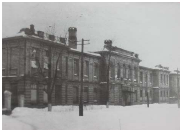
Руїни приміщень педінституту. 1943 р.