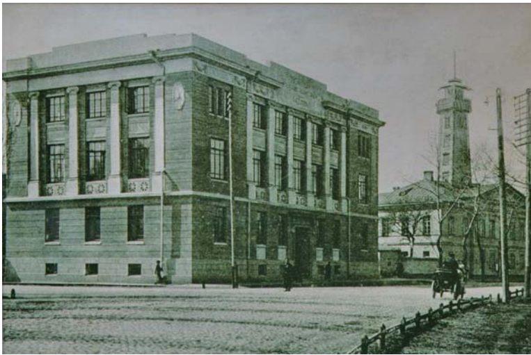
Будинок по вул. Луначарського, 2, де в 1920-их – 1930-их рр. працював історичний факультет ІНО, ІСВ та педінституту

рико-філологічного факультету в Полтаві лише до наступної реорганізації інституту.