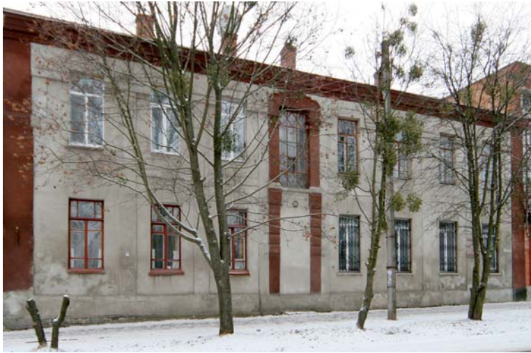
Будинок по вул. Фабрикантській (нині Балакіна), 14, де в 1914-1917 рр. розміщувався Полтавський учительський інститут. Сучасний вигляд.