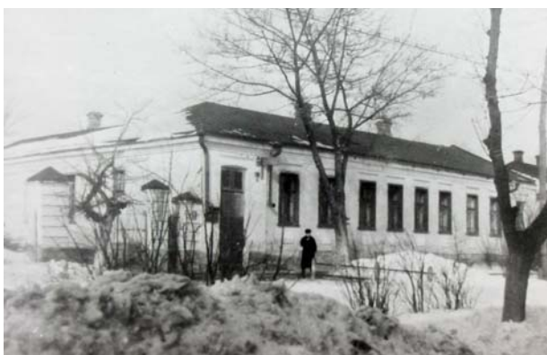
Будинки, у яких тимчасово розміщувався педінститут після визволення Полтави від німецько-фашистських окупантів