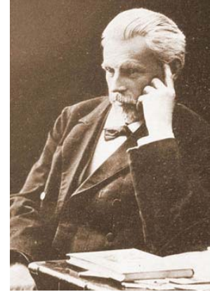
М. Ф. Сумцов – фольклорист, етнограф, професор академік ВУАН