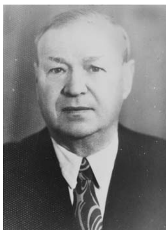
Ф. А. Редько