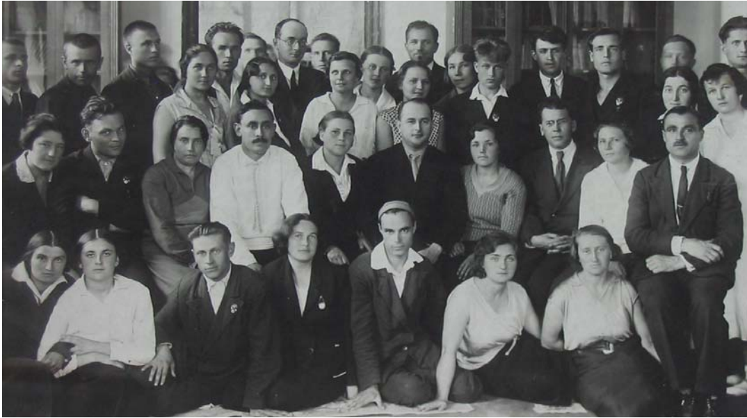
Зустріч групи викладачів Полтавського педінституту з відомими українськими письменниками Миколою Бажаном (другий ряд шостий зліва) та Павлом Тичиною (другий ряд восьмий зліва). Фото 1935 р.

вати в Полтавському педінституті, де читали лекції і проводили семінарські заняття з історії СРСР і УРСР на філологічному факультеті, на всіх інших – з історії КНРС.