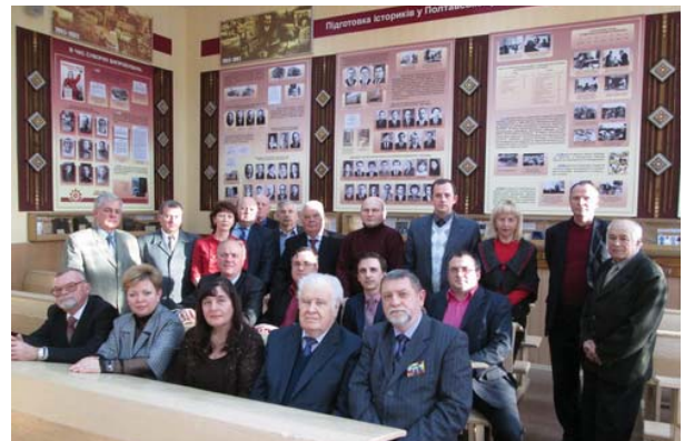
Відкриття музею історії факультету (листопад 2013 року)