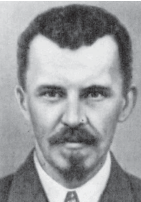
Ф. І. Шміт – візантолог, археолог, мистецтвознавець, професор, академік ВУАН