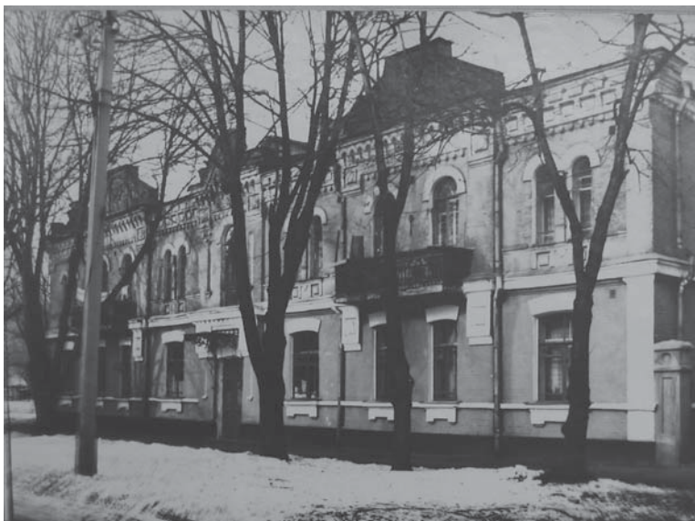
Будинок по вул. Новокременчуцькій (нині Лідова), 12, у якому в 1919-1921 рр. працював Полтавський педагогічний інститут. (Сучасний вигляд)

Створення нової системи вищої освіти повинно було вирішити й долю колишніх учительських інститутів, діяльність яких в Україні в роки Громадянської війни часто порушувалася та припинялася. У радянській Росії ще в середині 1918 року розпочалося перетворення учительських інститутів у педагогічні з чотирьохрічним терміном навчання. На основі досвіду РСФРР