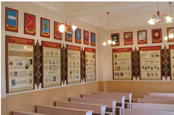
Кабінет історичного краєзнавства