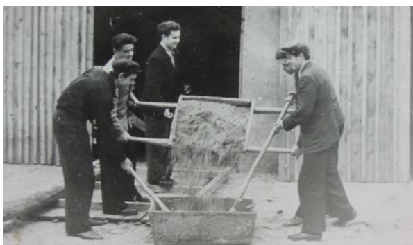
Студенти на відбудові навчального корпусу №1. 1954 р.