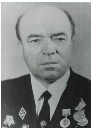
В. Г. Євтушенко