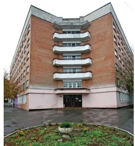
Гуртожиток №1 по вул. Монастирська, 7, де проживають студенти-історики

Перший досвід організаторської роботи ректор Полтавського педінституту (з 1999 року – педуніверситету) у 1990-2008 роках, доктор історичних наук, професор, член АПН В. О. Пашенко набув, протягом кількох років працюючи заступником декана філологічного факультету та деканом історичного факультету.