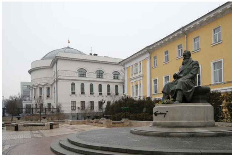
Будинок Центральної Ради (сучасний вигляд)

В умовах Української революції в країні широко розгорнувся рух за утвердження національної освіти. 10-12 серпня