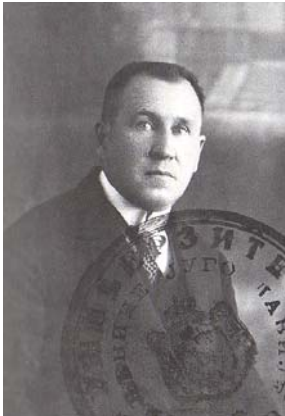
С. М. Кульбакін – філолог-славіст, паліограф, професор, член-кореспондент РАН