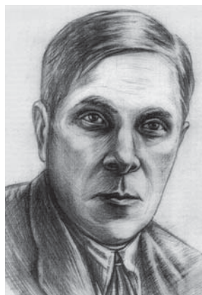
М. Я. Рудинський – археолог, історик мистецтв, один із керівників українського пам'яткоохоронництва