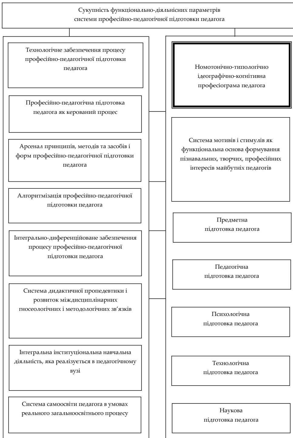
Мал.2. Функціонально-діяльнісна характеристика професійно-педагогічної підготовки педагога