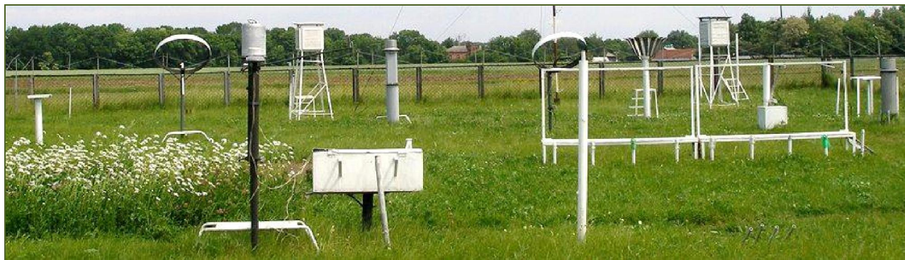
На майданчику метеостанції Полтави М.Самбікін проводив агрокліматичні спостереження