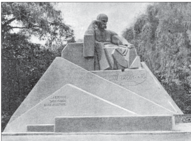
Пам'ятник Т. Шевченку в Полтаві

«Що собою являло відкриття? Натопв був величезний, зібралися люди з Полтави й навколишніх сіл. І коли під мелодію «Заповіту», яку написав Гордій Гладкий, із пам'ятника зняли покривало, кількатисячний хор почав співати. Усі, хто тоді приїздили в Полтаву, були співучими людьми і знали творчість Шевченка, – розповідає завідувачка науково-дослідного відділу етнографії Полтавського краєзнавчого музею Галина Галян. – Особливість пам'ятника полягає в тому, що постать Шевченка наче виростає із землі, а сам поет сидить на узвишші. Думаю, що Кавалерідзе не випадково зробив прив'язку до місця в центрі старої Полтави, адже Шевчен-