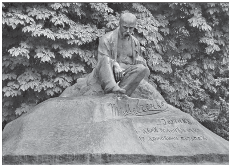
Пам'ятник Т. Шевченку в Ромнах

восьмої «революційної» річниці, в жовтні 1925 р. У березні все вже було готове, проте відкриття монумента затягувалося, оскільки в СРСР запанував метод соціалістичного реалізму, котрий був, м'яко кажучи, не дуже прихильним до «незрозумілих» кубізмів і конструктивізмів. Тому поки компартійні функціонери гальмували справу, І. Кавалерідзе зробив точну копію бетонного Кобзаря, якого спорудили в Сумах. Це, можливо, спонукало полтавців заворушитись і нарешті встановити в березні 1926 р. оригінальний пам'ятник поетові – навпроти архітектурної перлини Полтави, будівлі колишнього губернського земства. Там із 1906 р. діяв історико-природничий музей, за