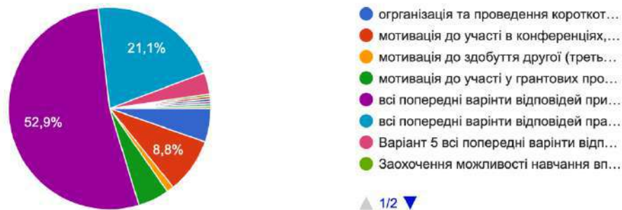
Рис. 2. Результати опитування майбутніх магістрів освітніх, педагогічних наук щодо ролі керівника закладу освіти в професійно-творчому розвитку педагогічних/науково-педагогічних працівників

На запитання «Як Ви оцінюєте підтримку та можливості, що надає Ваш університет для професійно-творчого розвитку студентів?» майбутні магістри всіх закладів вищої освіти загалом відповіли таким чином (у кількісному значенні) (рис. 3):