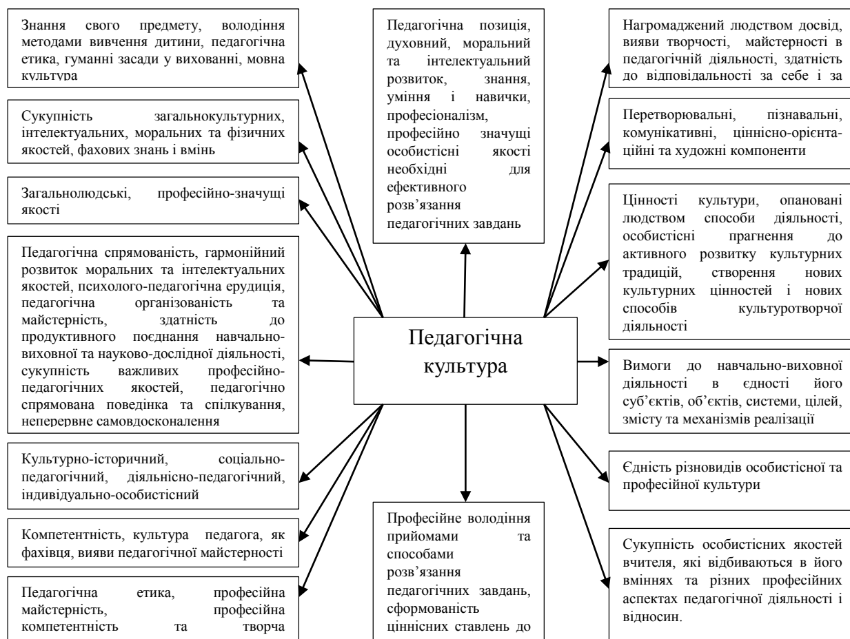
Рис. 1. Структура педагогічної культури бакалаврів з професійної освіти (дизайн).

Виходячи з розуміння складників педагогічної культури як змінюваних у часі її функціональних ознак та функцій, за схемою на рисунку 1, на засадах особистісного і діяльнісного методологічних підходів, уточнено структуру досліджуваного нами феномену як ключової культурної компетентності, за визначеними напрямками, видами та цілями педагогічної діяльності у наукових дослідженнях.