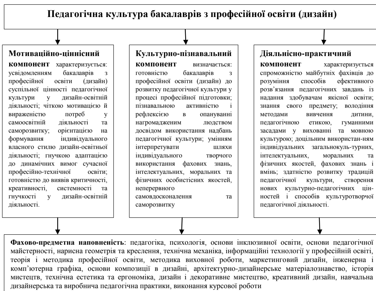
Рис. 2. Структурно-функціональна схема педагогічної культури бакалаврів з професійної освіти (дизайн)

педагогічної спрямованості та майстерності у розвитку традиційних та створенні нових освітньо-культурних цінностей шляхом індивідуального творчого використання фахових знань свого предмету, інтелектуальних, моральних та фізичних особистісних якостей, неперервного самовдосконалення та саморозвитку з метою ефективного розв'язання педагогічних завдань із надання здобувачам якісної професійної освіти. З опорою на представлені вище уніфіковані результати теоретичного дослідження та авторське визначення дефініції педагогічна культура бакалаврів з професійної освіти (дизайн) спробуємо здійснити власне трактування основних компонентів цієї особистісної якості: мотиваційно-ціннісний, культурно-пізнавальний та діяльнісно-практичний, які проілюстровані на рисунку 2.