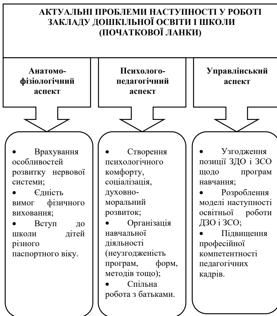
Рис. 2. Актуальні проблеми наступності у роботі закладу дошкільної освіти і школи

Встановлення спадкоємних зв'язків у розвиваючому навчанні математиці В. Туркіна вбачає у створенні «поля спадкоємних зв'язків» у різних математичних вміннях (проводити міркування, шукати докази, доводити твердження) (Turkina, 2003).