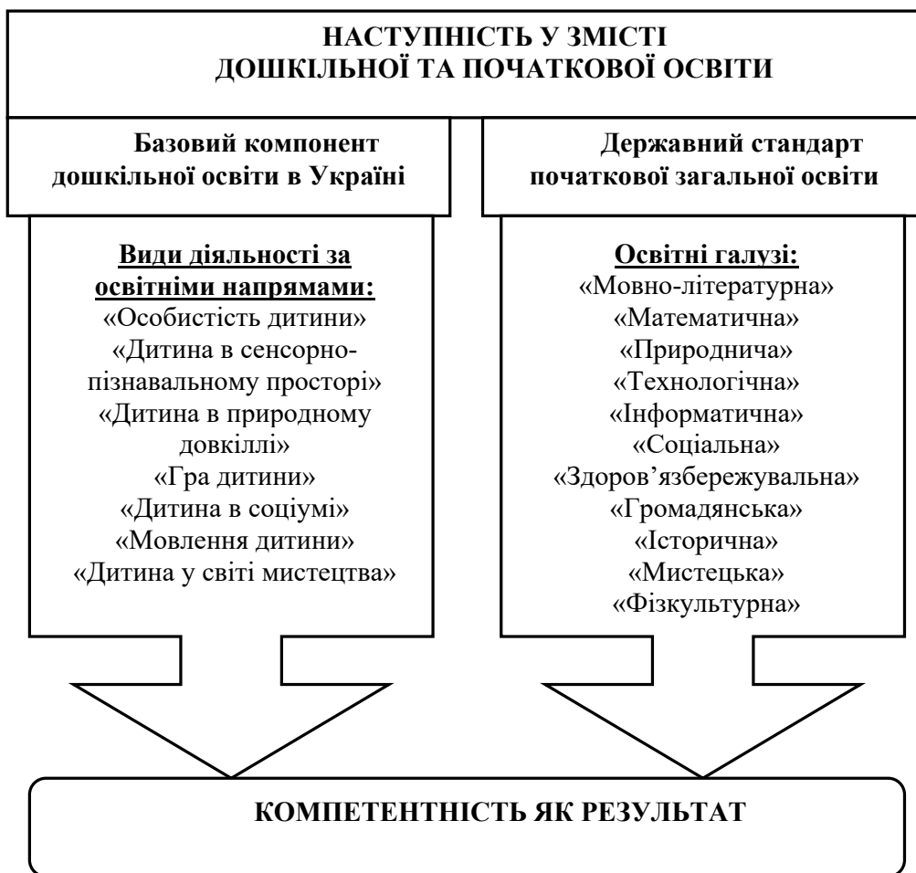
Рис. 1. Наступність у змісті дошкільної та початкової освіти

Близько 34 % опитаних педагогів висловили своє бажання отримати додаткову інформацію про зміст і умови ефективності реалізації наступності між дошкільною і початковою ланками освіти. Що ще раз доводить актуальність обраної теми.