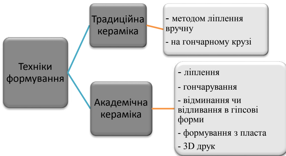
Рис. 2. Порівняння методів формування традиційної та академічної кераміки

Формування чи формоутворення як надання виробу форми може бути різним для традиційної та академічної декоративної кераміки (див. рис. 2).