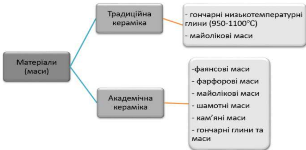
Рис. 4. Порівняння використання матеріалів (мас і глин) для виготовлення традиційної та академічної кераміки

Тобто, в академічній кераміці художник не обмежує свої можливості, він не зв'язаний традиційними методами декорування, а може робити все, що нафантазує. У традиційній кераміці митець має дотримуватися регіональних особливостей у методах декорування та формування.