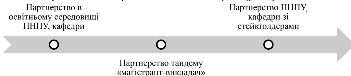
Рис. 1. Напрями реалізації педагогіки партнерства

Практичний досвід реалізації педагогіки партнерства у системі професійної підготовки менеджерів у Полтавському національному педагогічному університеті імені В. Г. Короленка (ПНПУ) на кафедрі педагогічної майстерності та менеджменту імені І. А. Зязюна уможливив виокремити такі основні напрями (рис. 1).