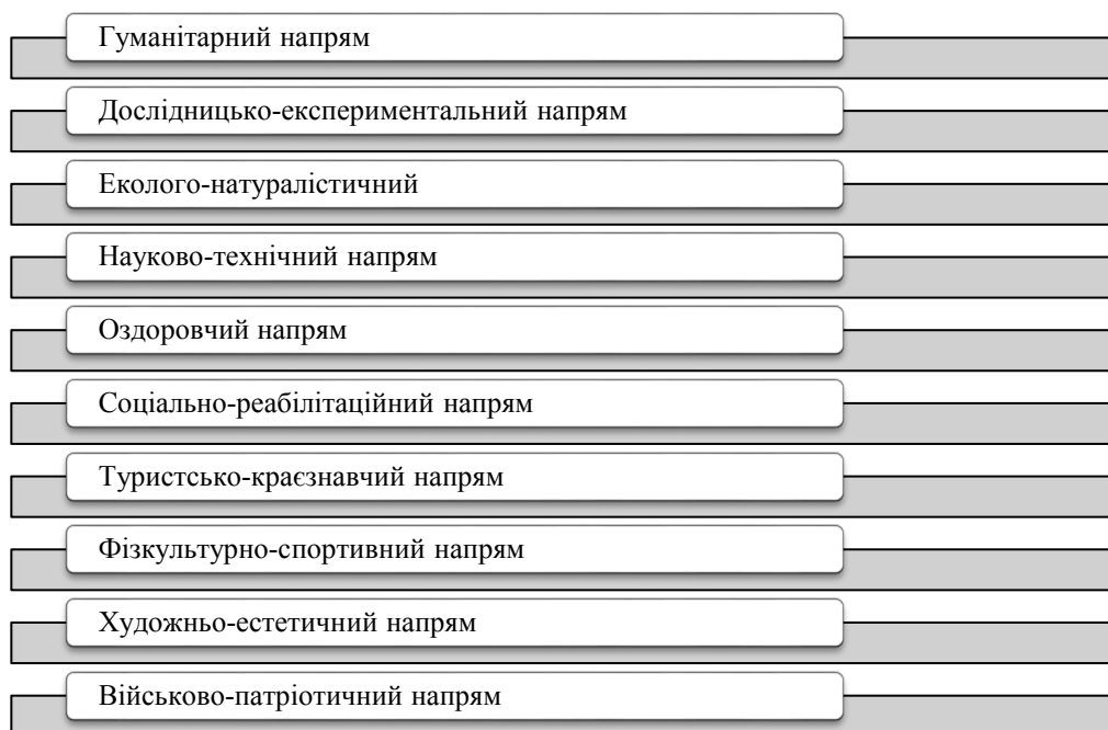
Рис. 1. Напрями діяльності шкільних гуртків

Виклад основного матеріалу. Педагоги-науковці Інституту модернізації змісту освіти виокремлюють напрями, за якими доцільно організувати гуртки у школі (рис. 1). Ці напрями слугують орієнтирами для організації позашкільної роботи загалом: проведення виховних заходів, бесід, екскурсій, майстер-класів, під час яких в учнів формуються необхідні життєві компетентності.