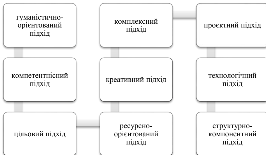
Рис. 3. Методологічні підходи підготовки майбутніх учителів до організації позашкільної роботи