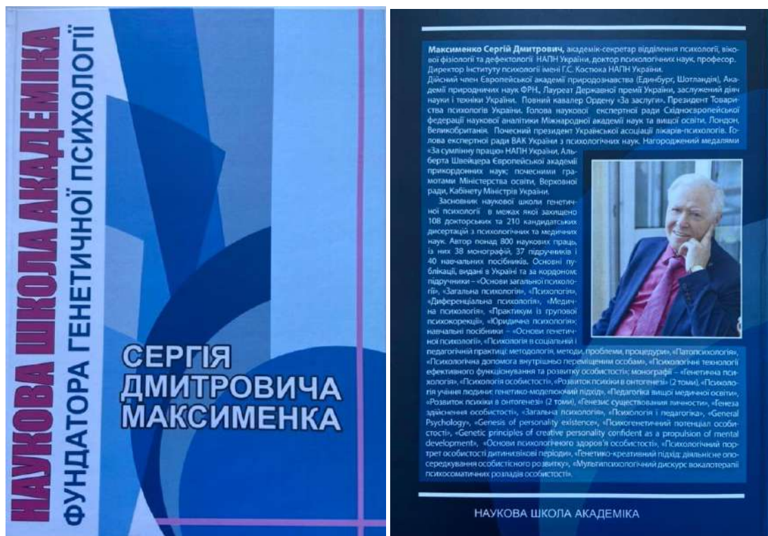
Рис. 2. Наукова школа академіка, фундатора генетичної психології С.Д. Максименка : ювілейна книга (2021 р.)

експериментально-генетичного, генетико-моделюючого, генетико-креативного методів генетичної психології (див. рис. 2).