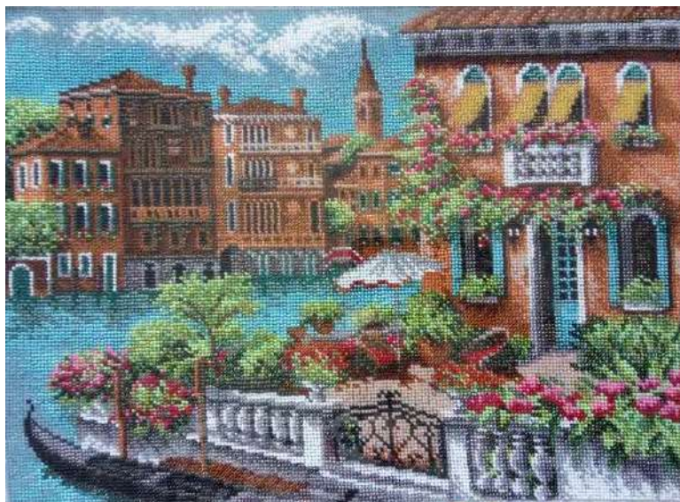
Рис. 1 Картина з бісеру «Венеція» вишита автором

Маючи досвід більше двох років вишивки картин бісером, можна із впевненістю сказати, що це заняття сприяє заспокоєнню, забезпеченню психологічного балансу, благополуччя (див. рис. 1, рис. 2).