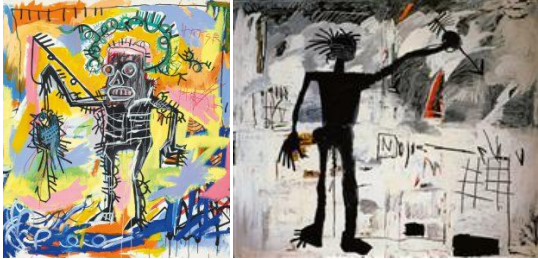
Рис. 2. Рибалка (акрил). Автопортрет (олівець, акрил)

Цей період тісно пов'язаний з іменем Жан-Мишеля Баскії. Свої ранні графіті він малює у віці 17 років. Це вперше були не теги, а цілком зрозумілі, змістовні фрази, які були призначені для всіх, а не лише для втаємничених. Молодий художник надав звичному явищу зовсім іншого характеру. Жан-Мишель мешкає у Брукліні, але малює на Манхеттені, біля знаменитих галерей сучасного мистецтва – для нього було важливим залишити послання мистецькому світу, який його не знав, але куди хлопцеві дуже хотілося потрапити.