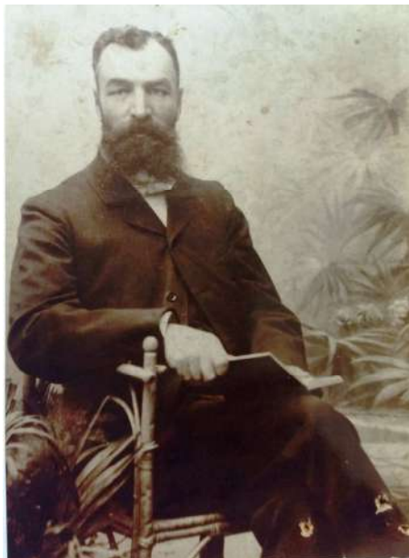
Рис. 2. Григорій Юркевич. 1860 р.

закінчення навчання її рідні придбали путівку за 98 рублів з Петербурга Балтійським морем через Німеччину, Францію, Італію, Грецію, Боснію, Хорватію, Словенію і Чорним морем повернулася до Одеси.