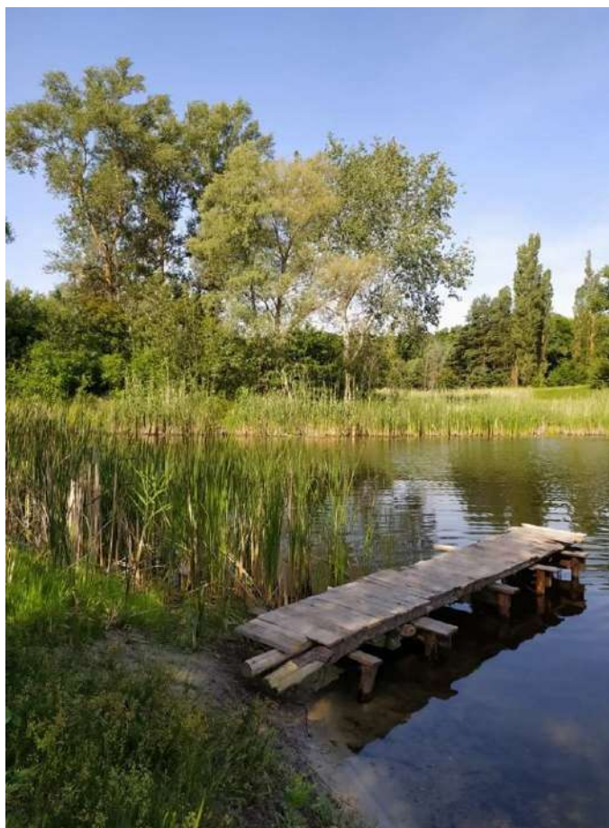
Рис. 13. Озеро на хуторі Ісаївка. Сучасний вигляд.

Залишилася Олена з трьома дітьми і все господарство лягло на її плечі. Допомогавав їй по господарству сусід Григорій Саліченко, який не мав власного господарства.