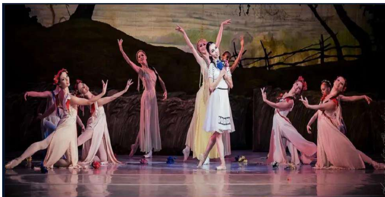
Рис. В.2. Балетна вистава «Лісова пісня» М. Скорульського. Національна опера України.