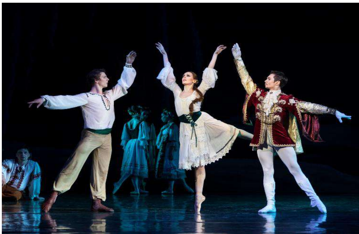
Рис. В.1. Балетна вистава «Лілея» К. Данькевича. Національна опера України.