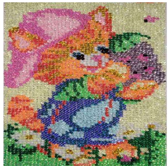
Рис. 6. Відпочинок від втоми.