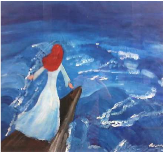
Рис. 7. Мої переживання.