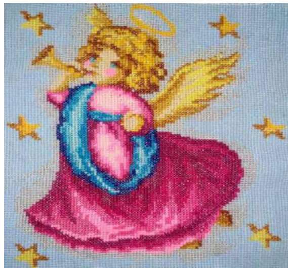
Рис. 8. Моя свобода.

Після проведеного спільно зі студентами аналізу представлених ними тем арт-щоденників нами зроблено висновок, що застосування запропонованої арт-техніки сприяє зняттю емоційної напруги в студентській молоді, зокрема: актуалізуються внутрішні ресурси; допомагають розібратися у власних прихованих станах, формах поведінки; допомагають зрозуміти себе та оточуючих людей; дозволяють по-новому поглянути на проблеми та знайти шлях до їх вирішення; підвищують впевненість у собі; знижують почуття тривоги.