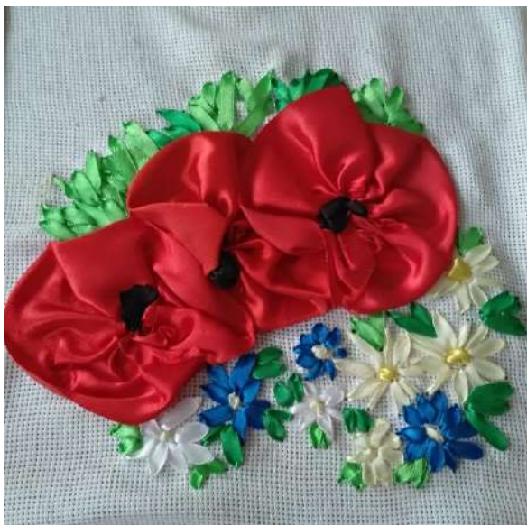
Рис. 5. Те, що приносить мені задоволення.