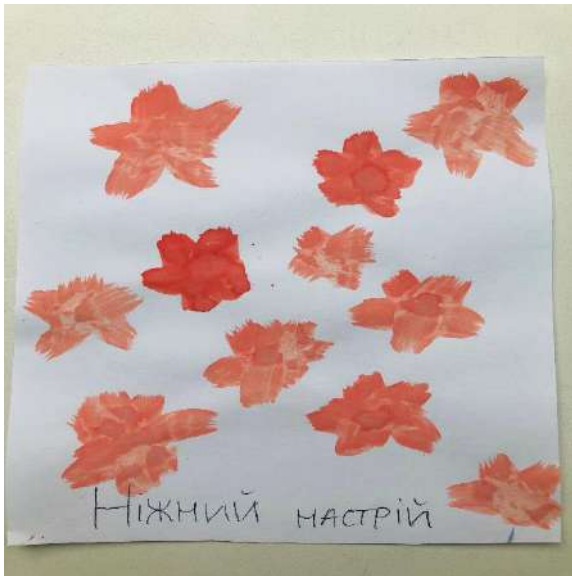
Рис. 3. Мій ніжний настрій.