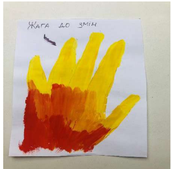
Рис. 4. Моя жага до змін