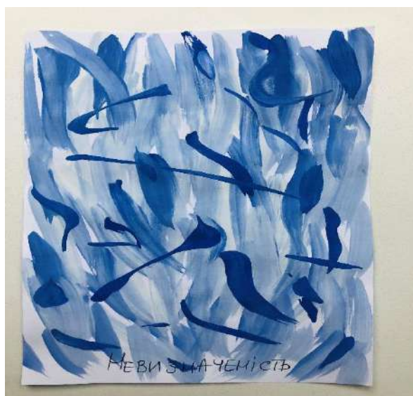
Рис.1. Моя невпевненість.

Для прикладу пропонуємо створені студентами теми сторінок з арт-щоденників «Мої емоційні стани» (див. рис. 1-8).