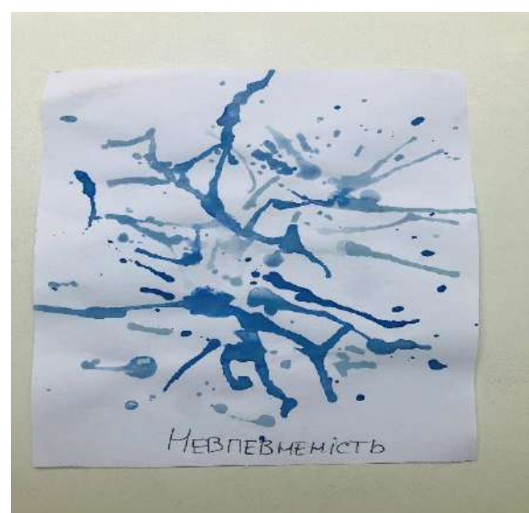
Рис.2. Моя невизначеність.