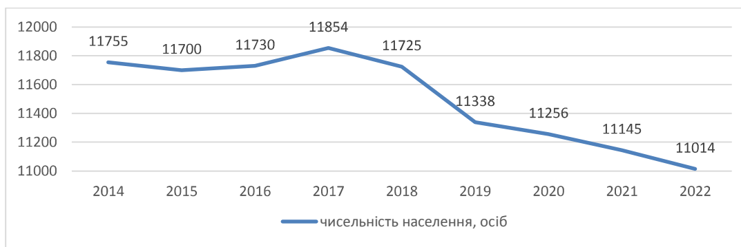
Рис. 2. Динаміка зміни чисельності населення м. Лохвиця у 2014-2022 рр, осіб (побудовано авторами за даними [5])

В Полтавській області є 6 міст, які мають статус обласного значення, а саме: Полтава, Кременчук, Горішні Плавні, Лубни, Миргород, Гадяч. Лохвиця ж належить до категорії малих міст, населених пунктів районного значення, адже нині не має важливого промислового значення і близьку перспективу подальшого економічного розвитку. В цей перелік входять також інші міста області такі як: Глобине, Гребінка, Заводське, Зіньків, Карлівка, Кобеляки, Пирятин, Хорол та Решетилівка (населений пункт набув статусу міста у 2017 році).