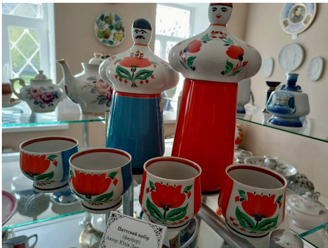
Питтєвий набір (фарфор) Автор: Юлія Литвиненко. 1994 р.