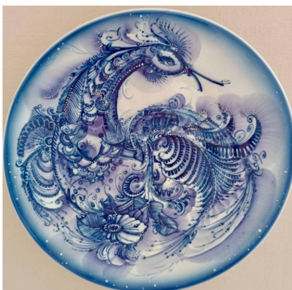
Декоративні настінні таріли. Автор: Інна Гуржій. 1999 р.