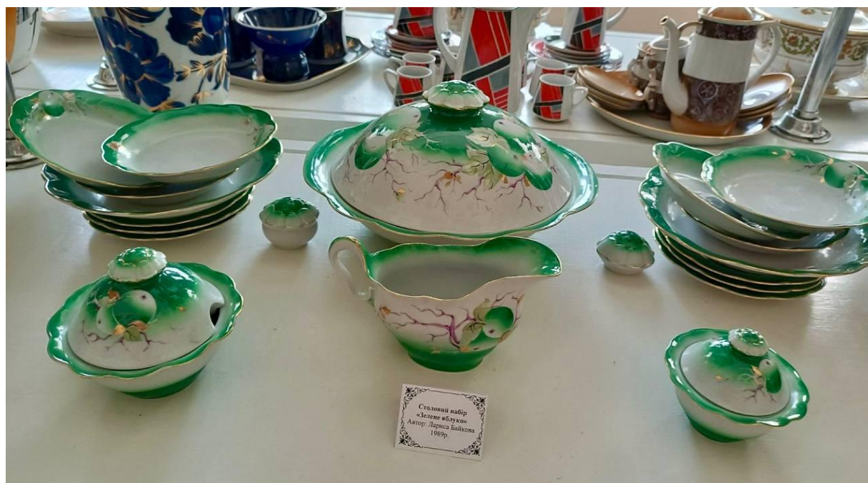
Столовий набір «Зелене яблуко» Автор: Лариса Байкова. 1989 р.