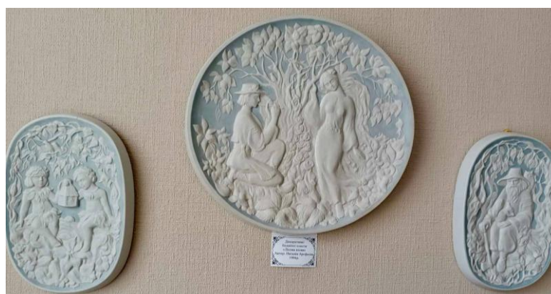
Декоративні бісквітні пласти «Лісова пісня». Автор: Наталія Арєфьєва. 1994 р.