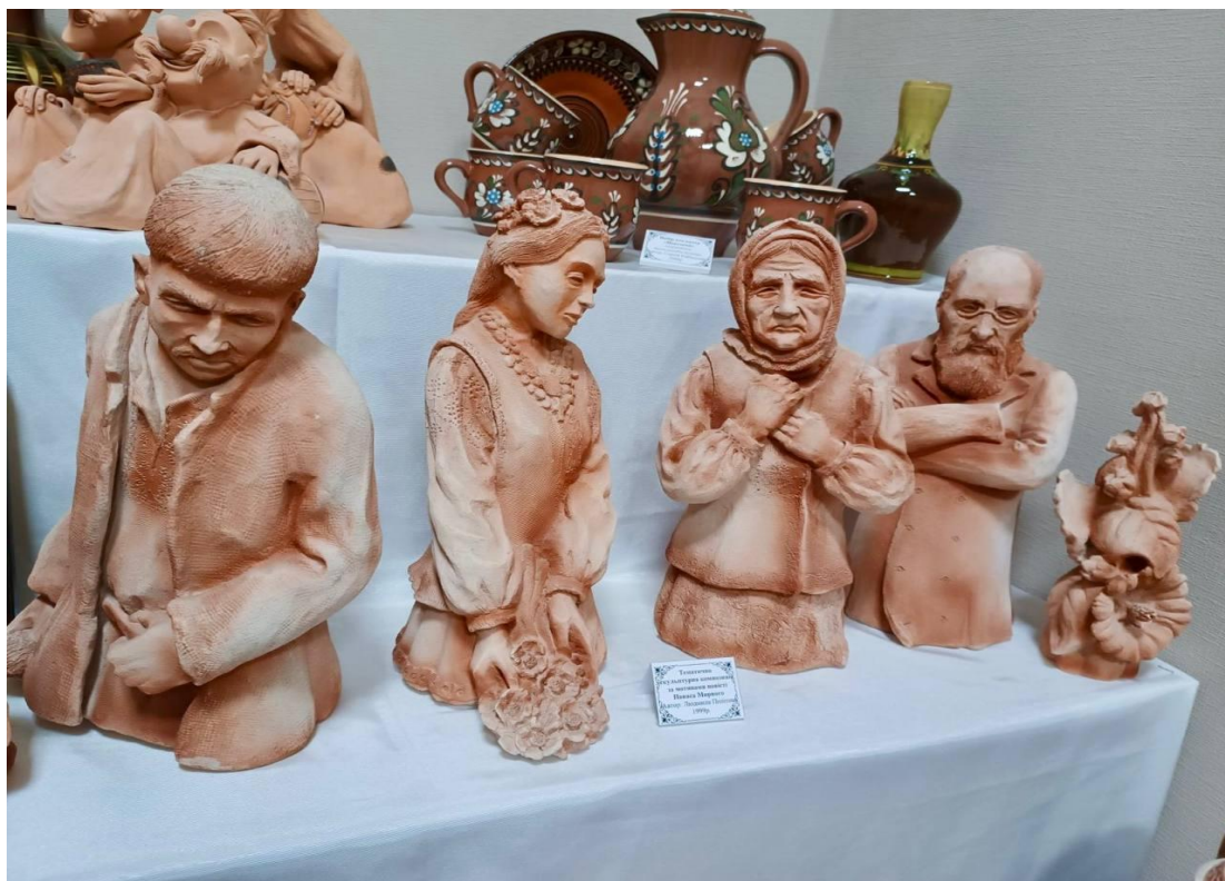
Тематична скульптурна композиція за мотивами повісті Панаса Мирного Автор: Людмила Політова. 1999 р.