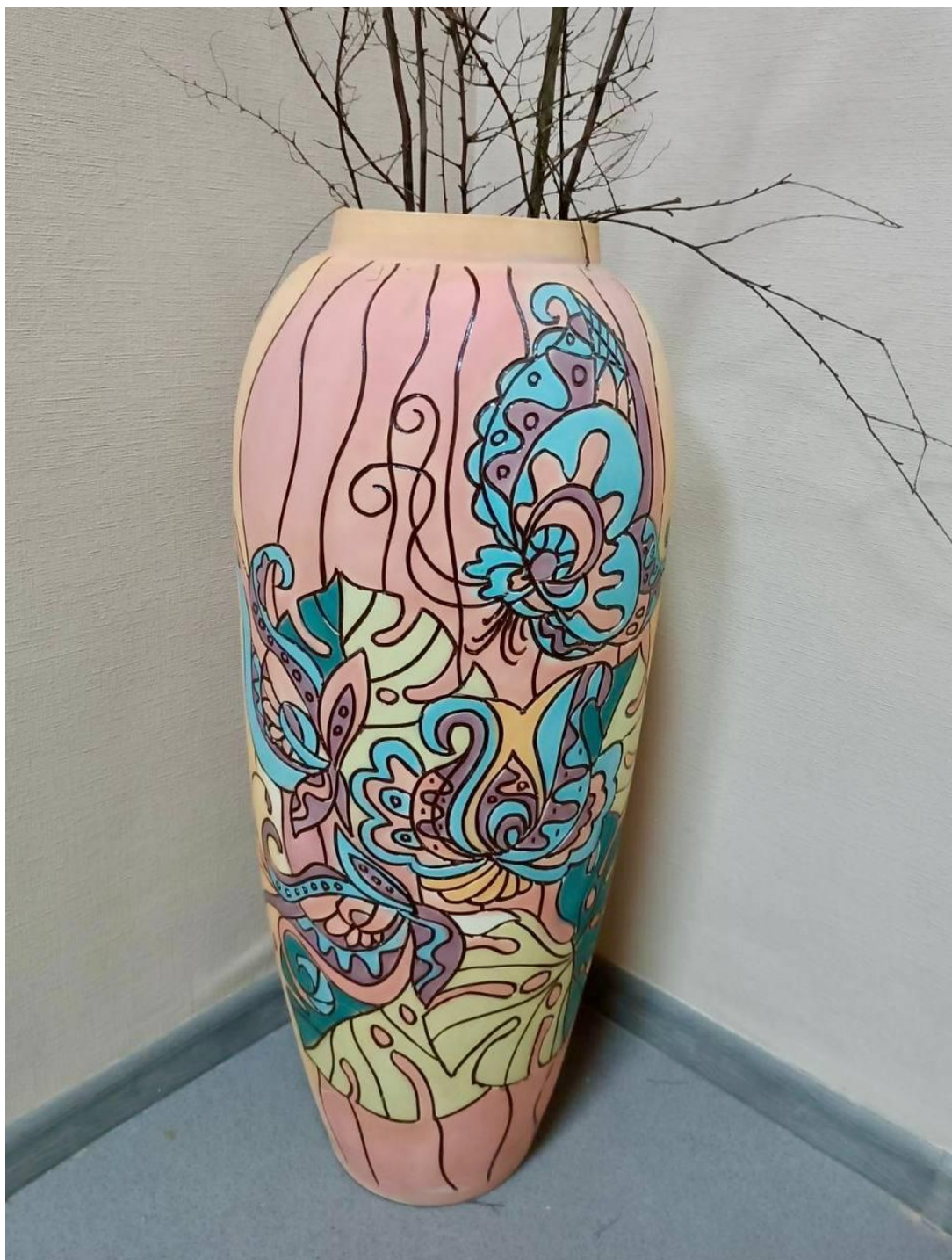
Декоративна ваза (керамічна маса, ангоби) Автор: Олена Асламова. 2010 р.