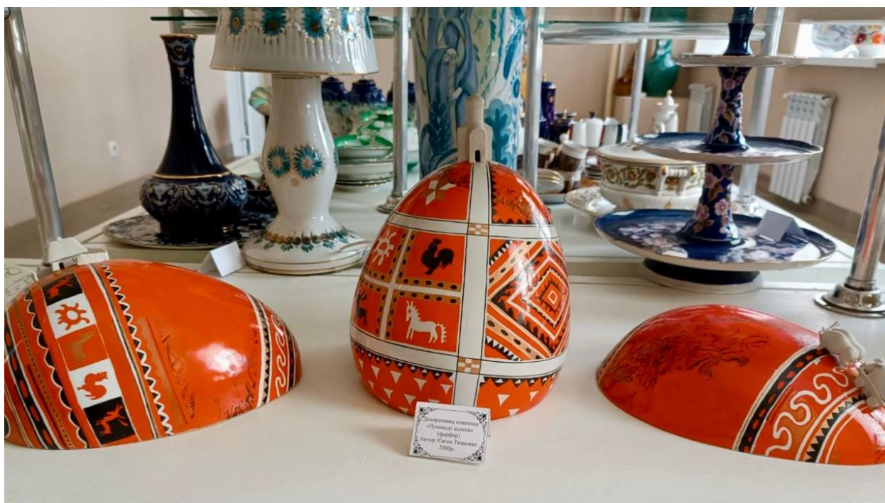
Декоративна пластика «Чумацькі шляхи» (фарфор) Автор: Євген Тищенко. 2000 р.