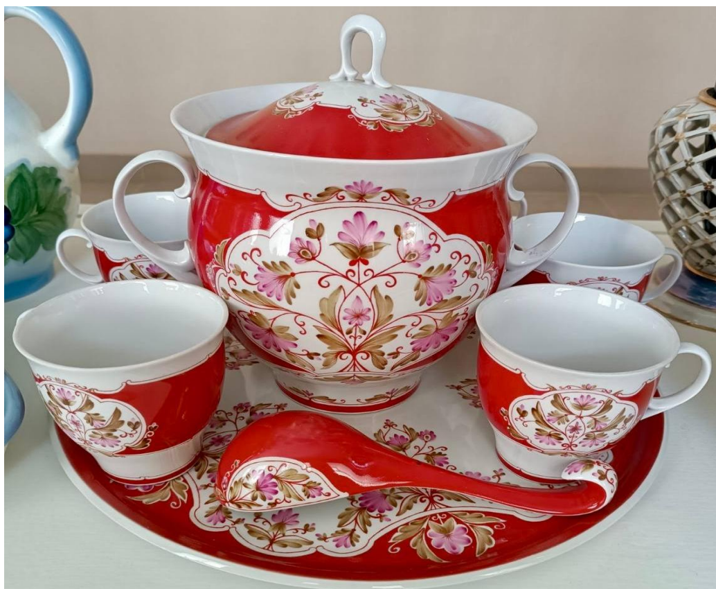
Набір для компоту (фарфор) Автор: Світлана Синенко. 1988 р.