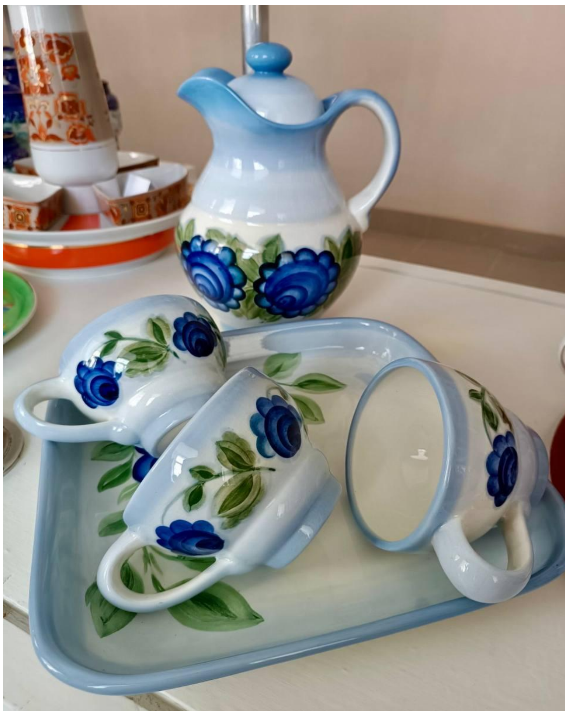
Набір для молока (фаянс) Автор: Світлана Компанієць. 1988 р.