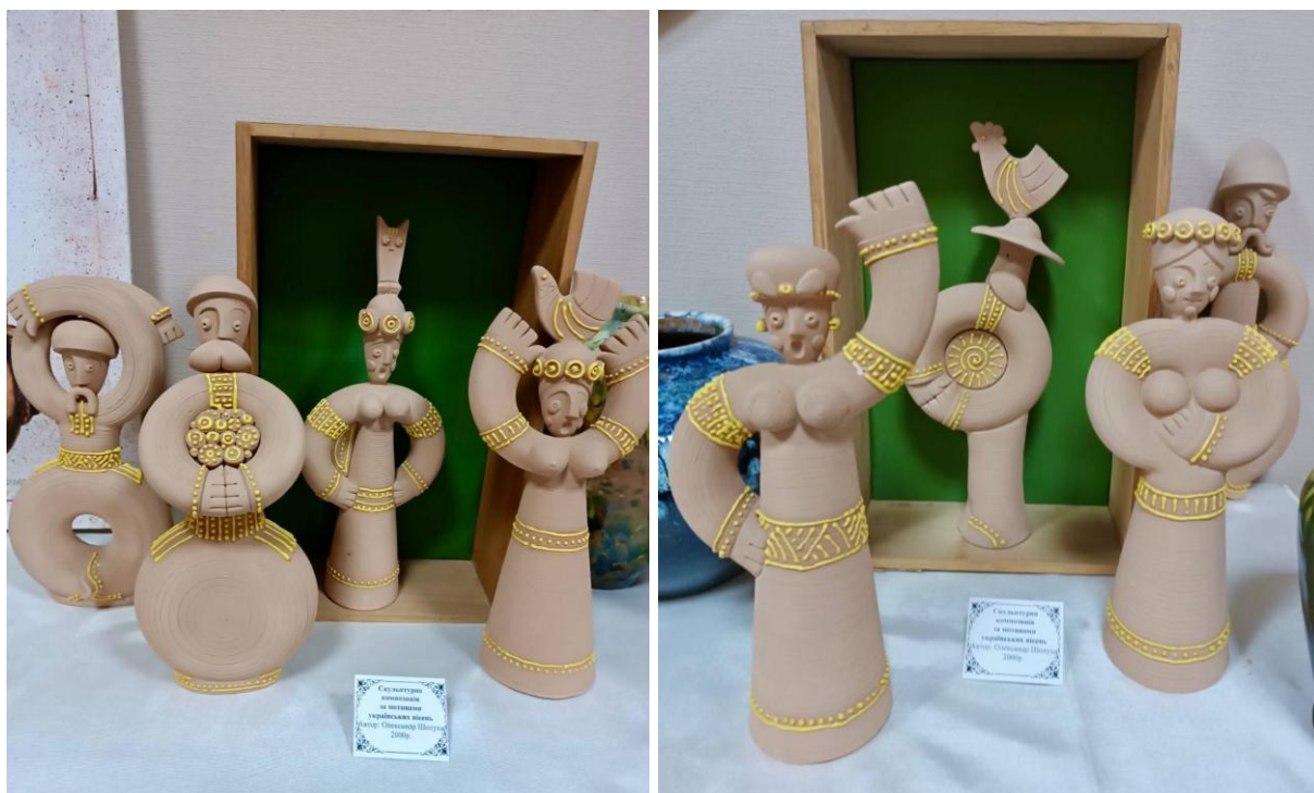
Скульптурна композиція за мотивами українських пісень Автор: Олександр Шолуха. 2000 р.