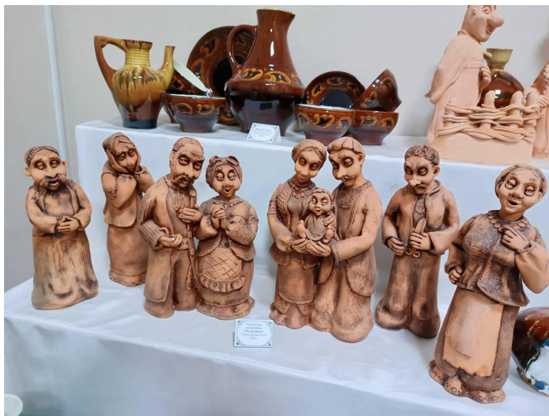
Скульптура малих форм «Пострижини» Автор: Олена Сітко. 2002 р.