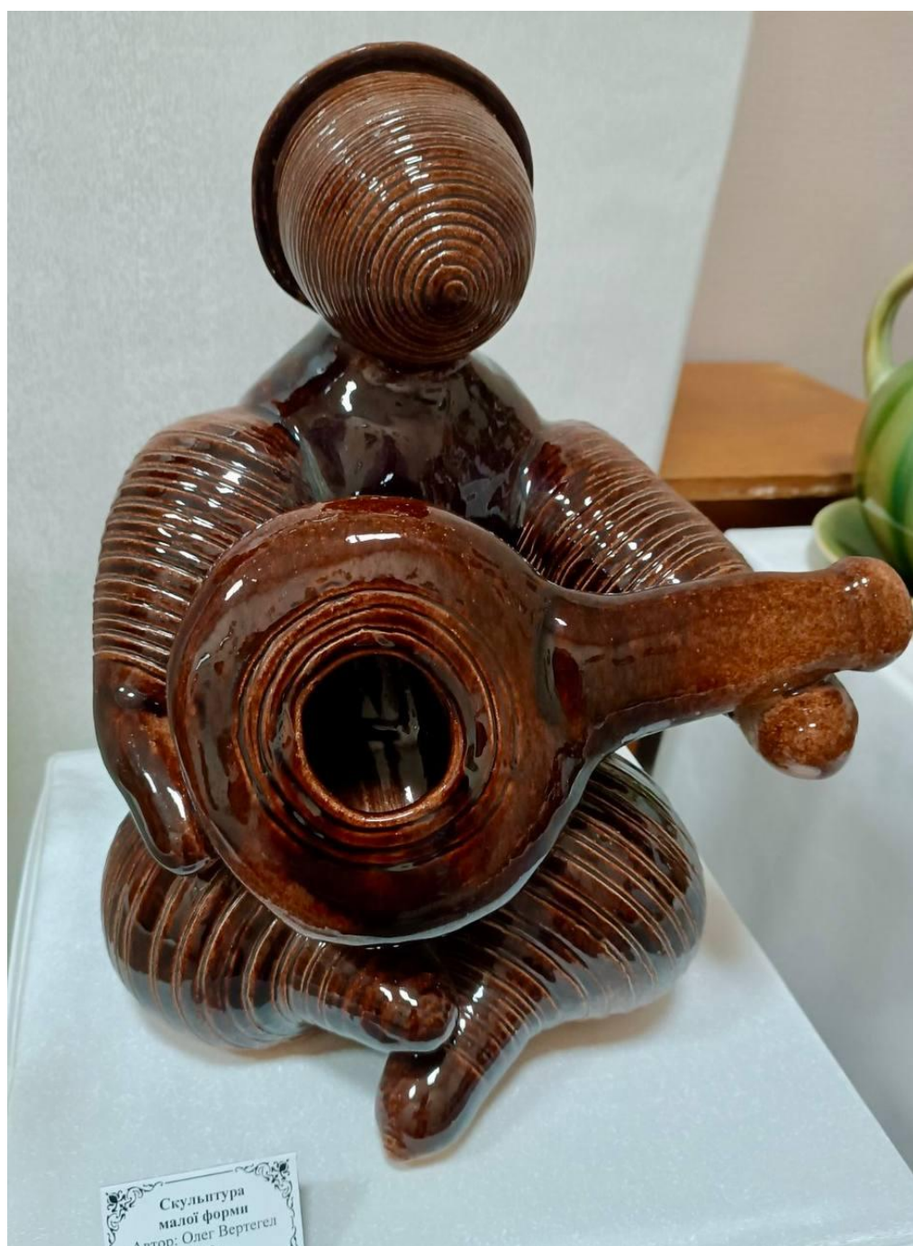
Олег Вертегел. Скульптура малої форми. 2012 р.