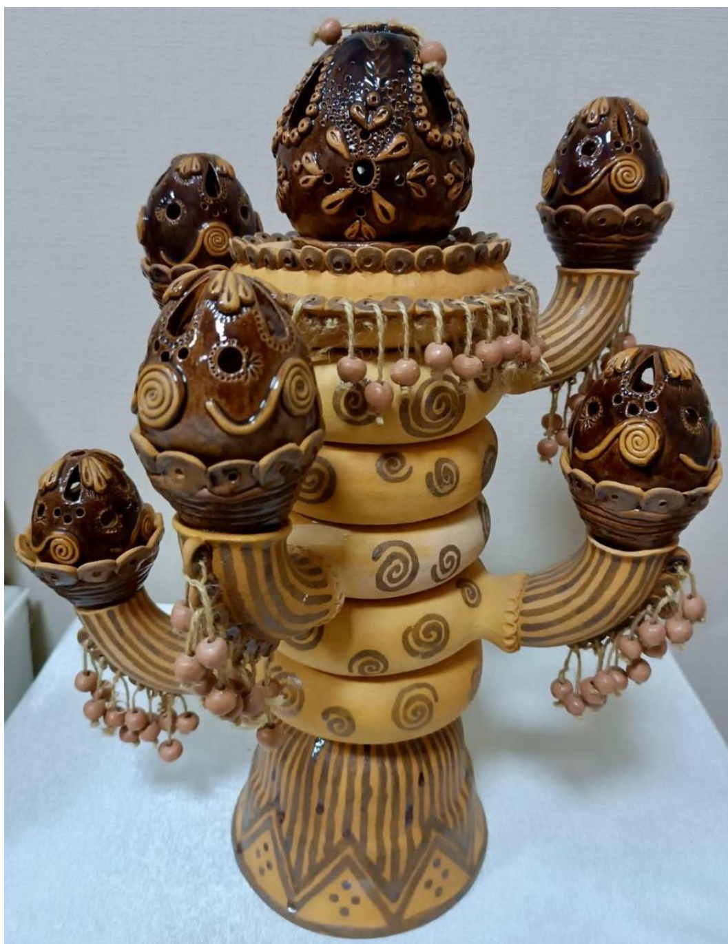
Катерина Гончарова. Декоративний підсвічник «Великдень». 2012 р.