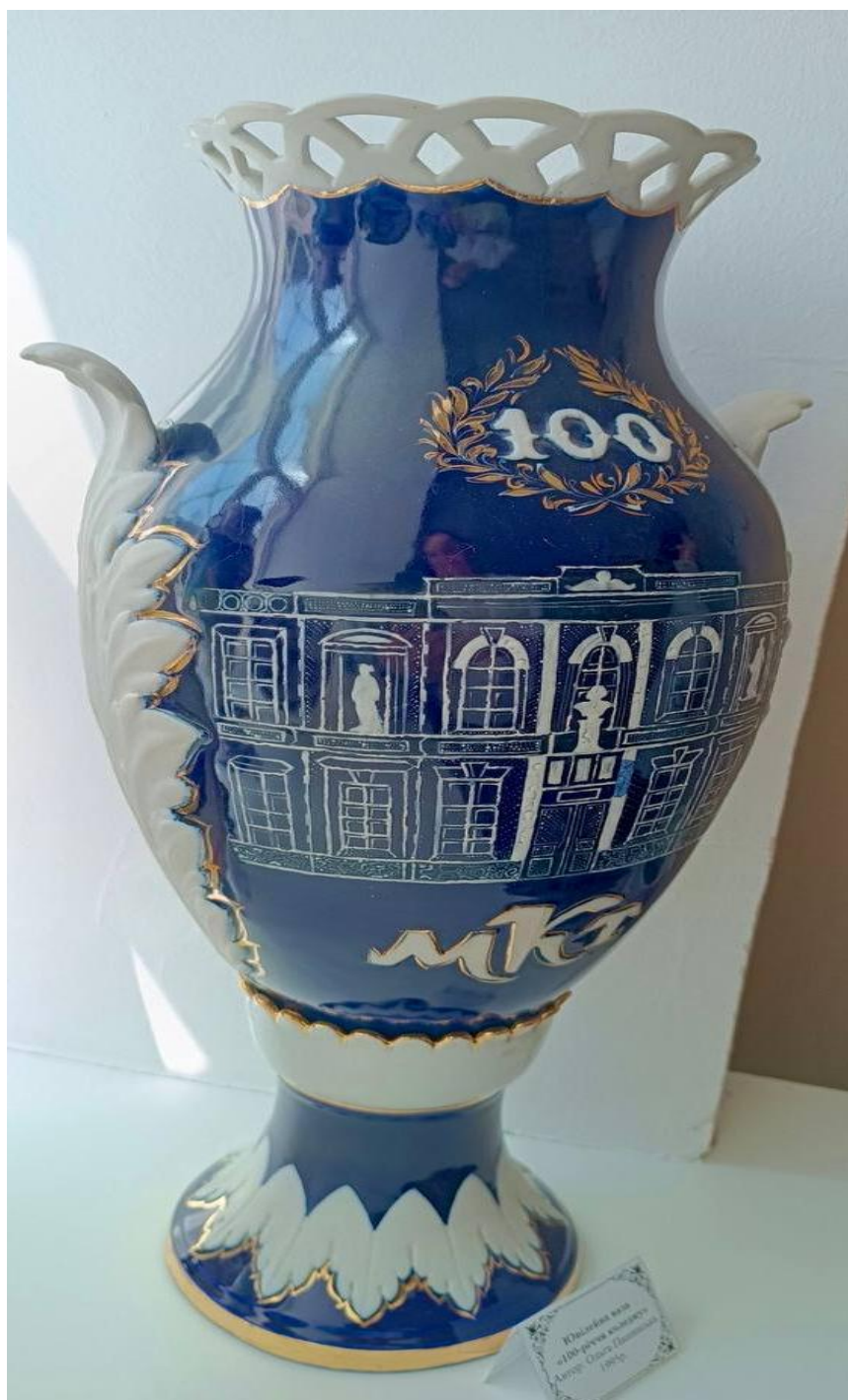
Ювілейна ваза «100-річчя коледжу» Автор: Ольга Пашинська. 1995 р.