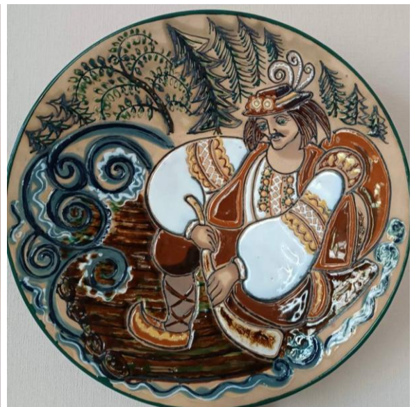
Олег Пріль. Декоративні блюда «Гуцули». 1981р. Керамічна маса, поливи