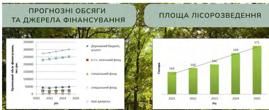
Рис.1, а) Прогнозні обсяги та джерела фінансування; б) Площа лісозведення

Аналіз показав, що згідно паспорту програми ініціатором розроблення, розробником, відповідальним виконавцем Програми є Кіровоградське обласне управління лісового та мисливського господарства, співрозробники програми Департамент екології, природних ресурсів та паливно – енергетичного комплексу Кіровоградської облдержадміністрації, учасниками програми є Кіровоградське обласне управління лісового та мисливського господарства; Департамент екології, природних ресурсів та паливно – енергетичного комплексу Кіровоградської облдержадміністрації; органи місцевого самоврядування; державні лісгосподарські підприємства. Загальний обсяг фінансових ресурсів, необхідних для реалізації програми, усього складає 1430215,80 тис. грн., у тому числі: державний бюджет 218504,10 тис. грн., обласний бюджет 11496,00 тис. грн., інші джерела 1200215,70 тис. грн. (Рис.1, а.).