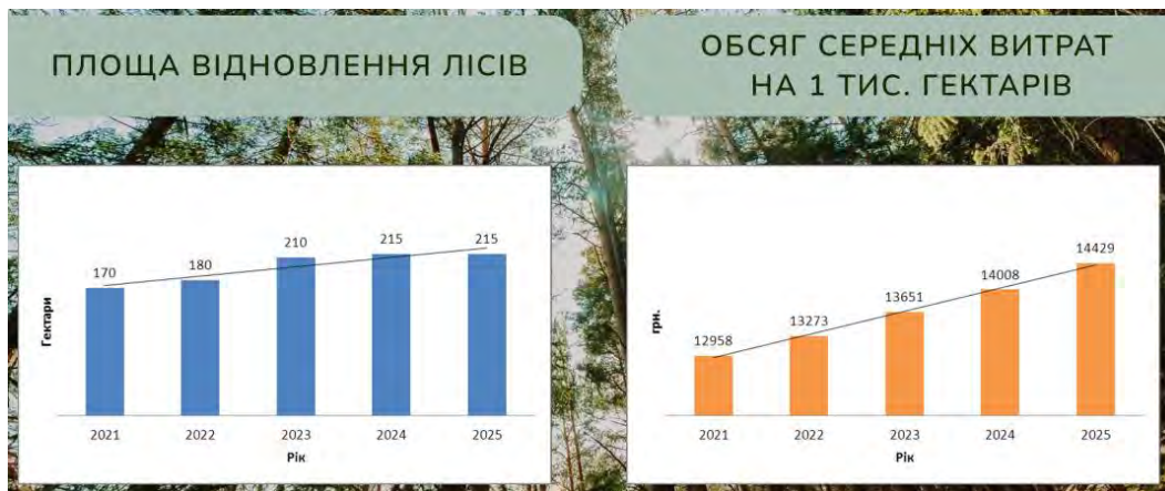
Рис.2, а) площа відновлення лісів; б) обсяг середніх витрат на 1 тис. гектарів

Відтворення, охорона і раціональне використання мисливської фауни, згідно якого показником виконання завдання є обсяг середніх витрат на 1 тис. гектарів, кількість диких копитних тварин у мисливських угіддях, а також обсяги створення захисних лісових насаджень на еродованих землях наведені на Рис.3, а, б. Проведення моніторингу стану лісів, згідно якого показником виконання завдання є обсяги створення захисних лісових насаджень на еродованих землях показало, найбільші обсяги на протязі всіх років виконання програми передбачаються для Кропивницького району. (Рис.3, б).