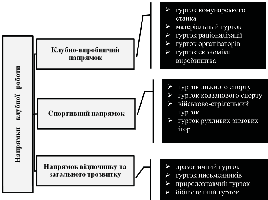
Рис. 2. Напрямки клубної роботи у виховній системі А.С. Макаренка

Аналізуючи свій досвід роботи для організації позашкільних заходів, Макаренко рекомендував створювати такі гуртки [2, с. 71]: хоровий, драматичний, літературний російський, літературний національний, музичний духовий, музичний струнний, музичний шумовий, художній, вільної майстерні, танцювальний, фото, природничо-дослідний, радіо, фізико-хімічний, іноземних мов, спортивний, казок, шаховий і шашковий.