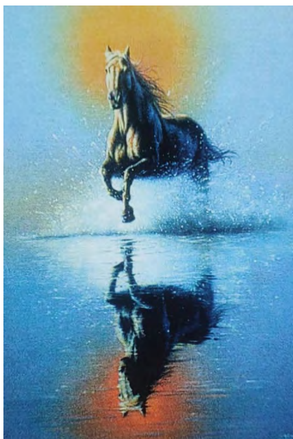
Рис. 1 - Моє майбутнє

Обґрунтування респондента: мій вибір супроводжувався такими емоціями як: упевненість та спокій. На картинці для мене відображено рух життя, його сенс, що потрібно спокійно дивитися в майбутнє та оцінювати свої можливості. Мати гармонію у своєму житті.