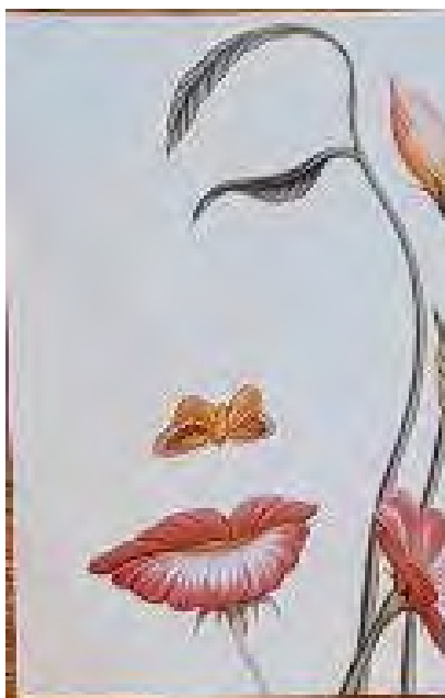
Рис. 2 - Людина, яку я люблю

Обґрунтування респондента: мій вибір супроводжувався такими емоціями як: упевненість та спокій. На картинці для мене відображено рух життя, його сенс, що потрібно спокійно дивитися в майбутнє та оцінювати свої можливості. Мати гармонію у своєму житті.