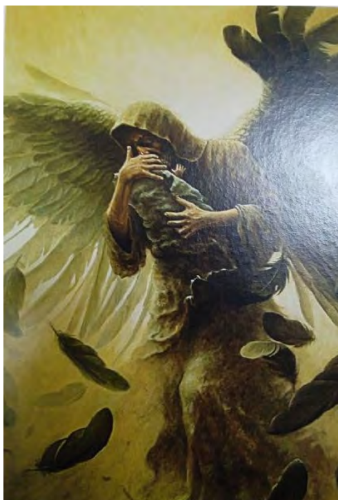
Рис. 10 - Людина, яку я поважаю

Обґрунтування респондента: це я намагаюсь відкриватись людям, відчуваю себе вразливою і не комфортно.