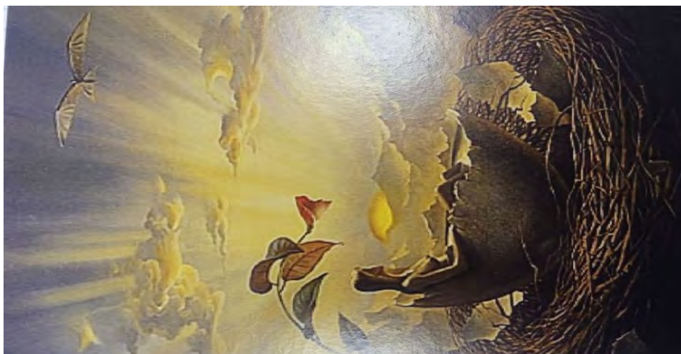
Рис. 7 - Мої бажання, мої можливості

Обґрунтування респондента: на цьому малюнку, схід сонця і ранок символізують для мене мої можливості і бажання, але я сиджу в гніздечку, дивлюсь на них збоку і не хочу виходити із зони комфорту, оскільки боюсь зробити помилку, несприйняття, осуду. Мені подобається ця картинка, в ній є щось добре і спокійне, з життєвим сенсом. Відчуття наче зійде сонце, дівчинка встане й почне робити свої справи, а зараз вона просто відпочиває і налаштовується.