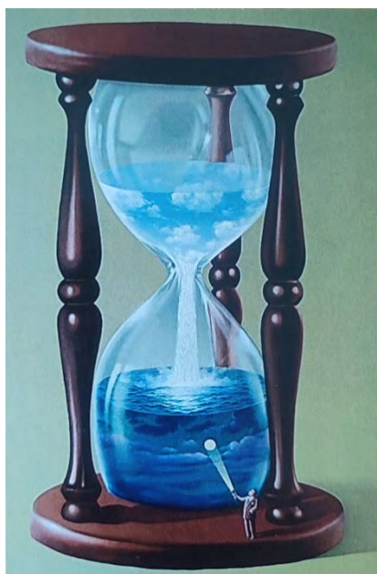
Рис. 3 - Моя мрія

картина підказка, що потрібно цінити та оберігати своїх жінок. Жінки – квіти за якими потрібно доглядати.