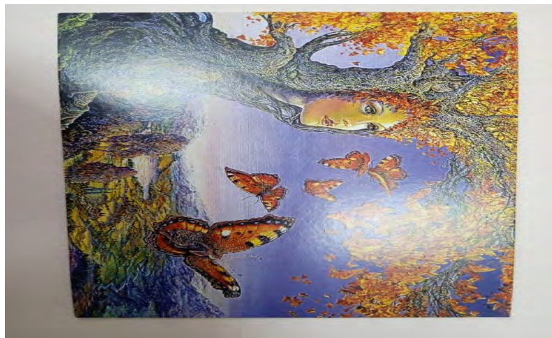
Рис. 6 - Самотність

Обґрунтування респондента: мій вибір супроводжувався такими емоціями як: надія, сподівання, очікування. Ця картина, на якій зображено двірну щілину, в якій видно красу. Для мене вона відображає те, що після поганого минулого йде щасливе майбутнє. Це підкреслює сенс моїх дій, мого існування.