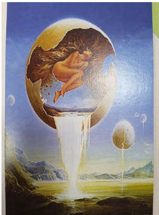
Рис. 9 - Мої намагання

відкриватись людям, це пов'язано з тим, що я боюсь неприйняття, а мені дуже важливо щоб мене любили, приймали, підтримували. І тому люди не знають яка я. не всі, точніше мало хто. І, на мою думку, мене бачать так.