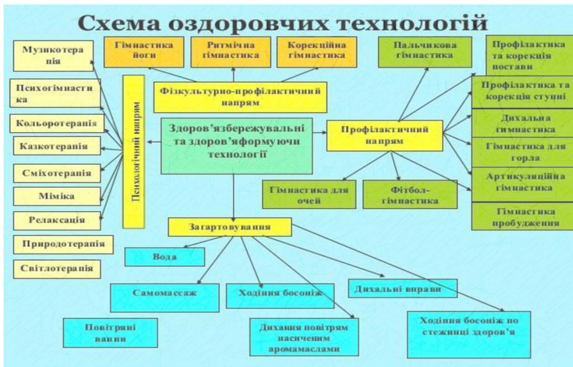
Рис. 2. Структура оздоровчих технологій

Ми пропонуємо користуватися даною структурою фізкультурно-оздоровчих технологій (Рис. 2). Відмінність фізкультурно-оздоровчих технологій від оздоровчих, здоров'язберігальних технологій, здоров'яформувальних, оздоровчо-рекреаційних технологій, технологій навчання здоров'я та ін., полягає в тому, що основним засобом фізкультурно-оздоровчих технологій є фізичні вправи й комплекси фізичних вправ, орієнтовані на гармонійний фізичний розвиток, підвищення рухової активності, функціональних можливостей організму та задоволення потреби в русі.