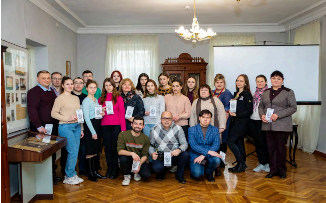
Фото 2. Майбутні географи – студенти Полтавського національного педагогічного університету імені В.Г. Короленка – учасники заходу до Дня геолога

віртуально мандрували полтавськими шляхами геологічних досліджень Володимира Івановича, ознайомилися із унікальними об'єктами Кременчуччини, Лубенщини, Хорольщини, особливостями їх будови та розташування, сучасним станом тощо. Особливу зацікавленість в учасників викликали розповіді про «хорольське золото» та Гінцівську пізньопалеолітичну стоянку.