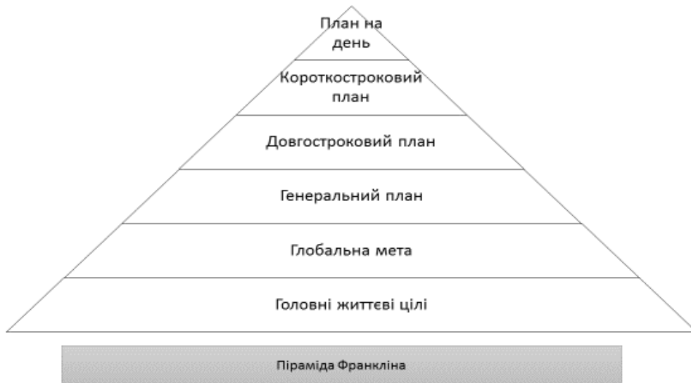
Рис. 2. Піраміда Б. Франкліна

Найважче працювати саме з формуванням власних цілей. Фактично, мета – це ідеалізоване втілення результату якоїсь діяльності людини з задачами та методами досягнення. Неправильна сформована мета гарантує провал будь-якої діяльності, тому вона повинна бути сформована чітко, ясно та позитивно. Цілепокладання – важкий і довготривалий процес, адже абстрактним бажанням необхідно дати форму чітко окресленої установки довготривалого періоду. Водночас занадто глобальні цілі не мають необхідного мотиваційного імпульсу до діяльності, адже просто стає незрозумілим з чого потрібно починати, хоча саме вони подекуди допомагають визначити власні цінності та сенс життя. Тож глобальні цілі повинні отримати чітку структуру вираження.