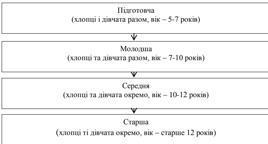
Рис. 2. Поділ дітей на вікові групи для заняття танцями [4, с. 66]

6. Метод виховання підсвідомої діяльності. Повноцінна творча діяльність не може реалізуватись без участі підсвідомості. Чим багатша підсвідомість, тим яскравіше, несподіваніше у момент творчого процесу вона підкаже рішення. Виховання підсвідомої діяльності розпочинається із дошкільного віку та реалізується шляхом накопичення вражень – зорових, слухових і чуттєвих. У дитячих хореографічних колективах можуть займатися діти віком від 5-6 до 16 років. Тому потрібен диференційований підхід. Поділ занять танцями відбувається за віковими та статевими ознаками. У колективах, про які йде мова, хлопці та дівчата розділені на чотири вікові групи (рис. 2). Розподіл пояснюється фізіологічними особливостями розвитку дітей, специфікою вправ для них. Окрім того, з середньої і старшої груп формується основний склад ансамблю [4, с. 66].