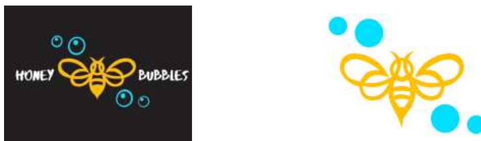
Рис. 2. Варіанти логотипу бренду косметики (автор Бондарчук А.)

Висновки. В рамках навчальної дисципліни «Комп'ютерний дизайн» студенти набувають готовності до підтримки вітчизняного