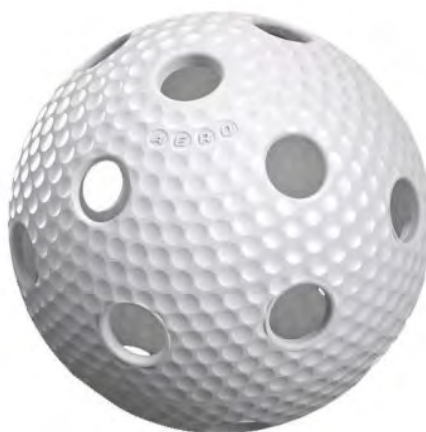
М'яч для флорболу