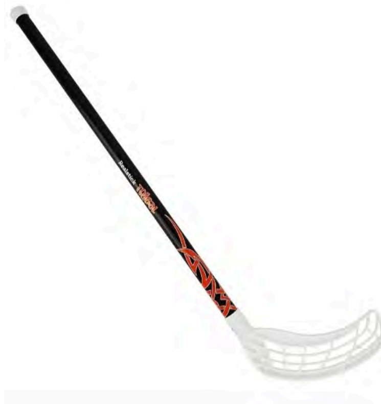
Ключка для флорболу