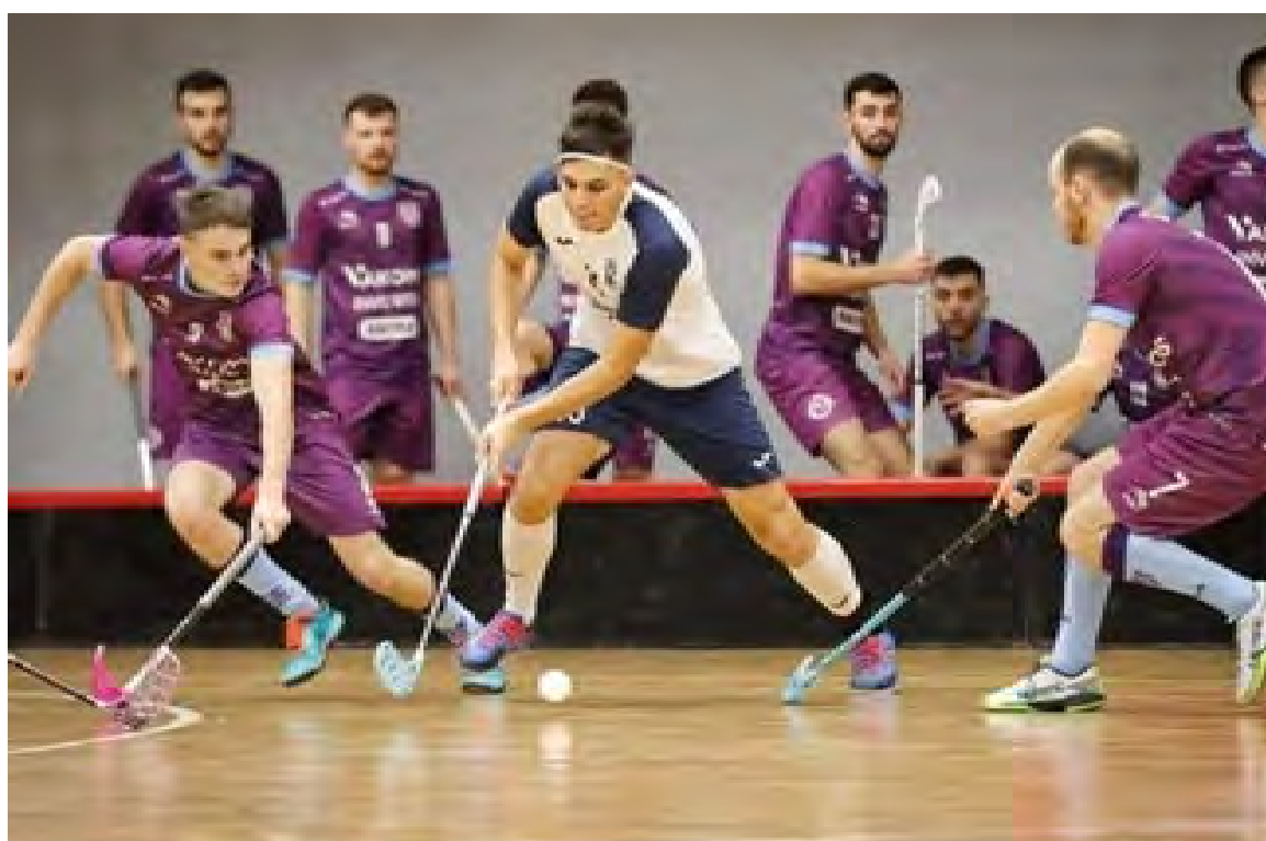
Гра у флорбол