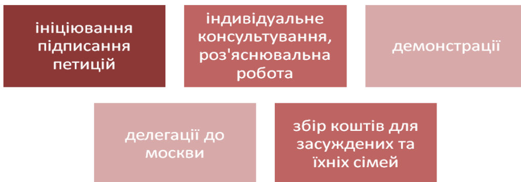
Рис. 1. Основні напрями діяльності кримськотатарських правозахисників у 60-х рр. XX ст.

На початок 60-х років петиції підписувало вже більше 100 тисяч чоловік. Це свідчило про те, що рух кримських татар став всенародним. Проте влада залишалась глухою до прохань цілого народу. На початку 60-х років почалися репресії. Вони призвели до спаду петиційних кампаній. Проте з 1964 року кримськотатарський рух, який поповнився молодими освіченими рішучими людьми, переходить до більш активної боротьби. Починаються масові мітинги і демонстрації кримських татар. Вони проходили в дусі того часу на радянські свята, особливо у дні народження Леніна, з усією відповідною атрибутикою, але зі сміливими промовама та вимогами. Відзначали кримські татари і день депортації – 18 травня.