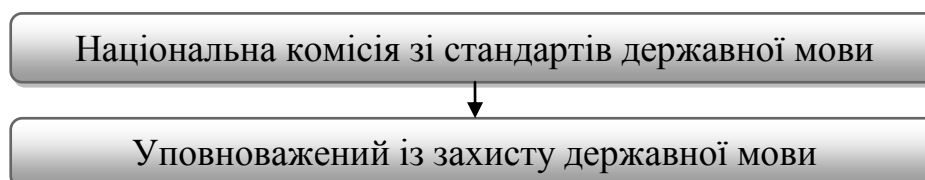
Рис. 1. Нові інституції щодо захисту державної мови в сучасній Україні

Мовна політика держави часто стає об'єктом маніпуляцій та розпалювання міжнаціональної ворожнечі. Сьогодні, коли кожен із нас тримає свій фронт, ми, освітяни, переймаємося тим, щоб і в освітньому процесі, і в побуті, і в спілкуванні, ми використовували нашу рідну солов'їну. Відомо, що 16 липня 2019 року набули чинності норми нашого так званого мовного закону «Про забезпечення функціонування української мови як державної», ухваленого 25 квітня 2019 року. Попри його критику з боку громадськості, своїм рішенням від 14 липня 2021 року Конституційний Суд визнав його конституційним, а тому норми цього правового акту продовжують реалізовуватися. У статті простежимо особливості правового інституту державної мови в сучасній Україні. Важливими елементами в структурі цього правового інституту є діяльність Національної комісії зі стандартів державної мови та робота Уповноваженого із захисту державної мови [1-3].