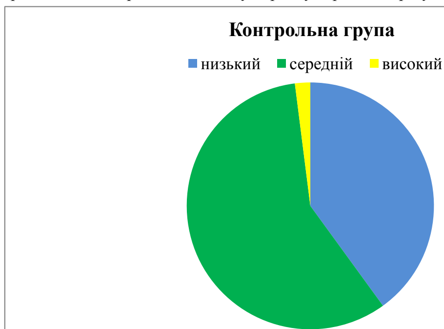
Рис. 2. Результати констатуючого експерименту в контрольній групі(у %)

Якісний аналіз результатів констатуючого експерименту по кожній групі окремо дозволив зробити кількісну обробку отриманих результатів.