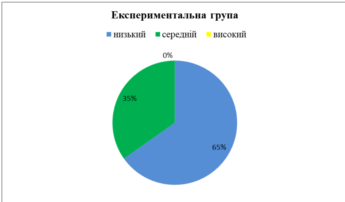
Рис. 3. Результати констатуючого експерименту експериментальній групі (у %)

Як видно з таблиць 1 і 2 та рис. 1 значних відмінностей за показниками немає. Можна відзначити той факт, що, незважаючи на приблизно рівні середні результати обох груп (44,8 і 47,2) діти контрольної групи перебувають на середньому рівні сформованості знань про українські народні казки, а діти експериментальної групи на низькому. Це сталося з причини того, що в контрольній групі одна дитина (Даниленко Владислава) за результатами виконаних завдань набрала 85 балів, що відповідає високому рівню знань українських народних казок.