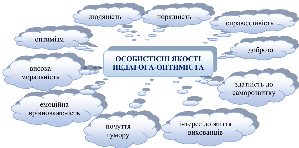
Рис. 1. Особистісні якості педагога-оптиміста (П. Вітебська)

образу сучасного вчителя [4]. Ми цілком погоджуємося з дослідницею, що важливими є людські якості сучасного вчителя, які стають професійно значимими передумовами створення сприятливих відносин в освітньому процесі та підґрунтям для формування педагогічного оптимізму педагога (рис. 1). Серед них: людяність, доброта, терплячість, порядність, відповідальність, справедливість, обов'язковість, об'єктивність, щедрість, повага до людей, висока моральність, оптимізм, емоційна врівноваженість, потреба спілкування, інтерес до життя вихованців, доброзичливість, самокритичність, чуйність, спрямованість, свідомість, почуття обов'язку, дисциплінованості, вміння працювати з дітьми, самокритичність, здатність до саморозвитку, почуття гумору тощо [4]. Відтак, педагогічний оптимізм відіграє важливу роль у процесі створення образу сучасного вчителя і виступає одним з елементів мотивації всієї діяльності та поведінки сучасного вчителя, забезпечує збіг його поглядів, життєвих позицій та орієнтацій, перспектив та цілей, завдань та інтересів з цілями, завданнями та інтересами суспільства.