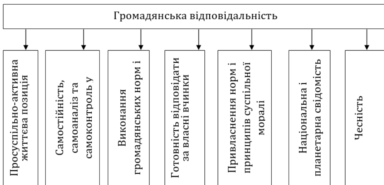
Рис. 1. Компонентний склад громадянської відповідальності

Проведений нами аналіз результатів досліджень з розуміння