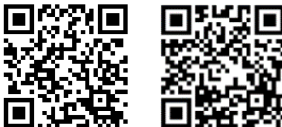
Рис. 1. QR-коди

Бібліотеки – сприяють розширенню світоглядного кола осіб, які підвищують свою кваліфікацію через призму презентації низки видань, що були заборонені до здобуття Україною Незалежності (1991 р.). Серед них: «Чтиво», «Діаспоріана» тощо. Їх контент закумульовано на віртуальних шпальтах. Він репрезентує широкий масив досліджень науковців. Покликання на онлайн-бібліотеки («QR-коди») зображено на рисунку 1: