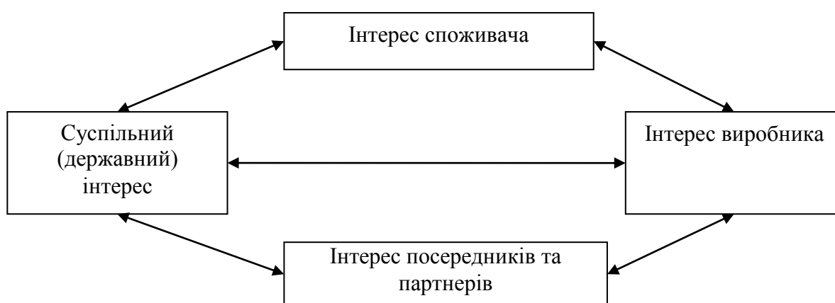
Рис. 3. Координація економічних інтересів у ринковій економіці

При цьому слід мати на увазі, що у ринковій економіці домінує особистий інтерес споживача. Практика розвитку передових західних країн засвідчує, що найефективнішим засобом узгодження та реалізації економічних інтересів є їх координація (рис. 3).