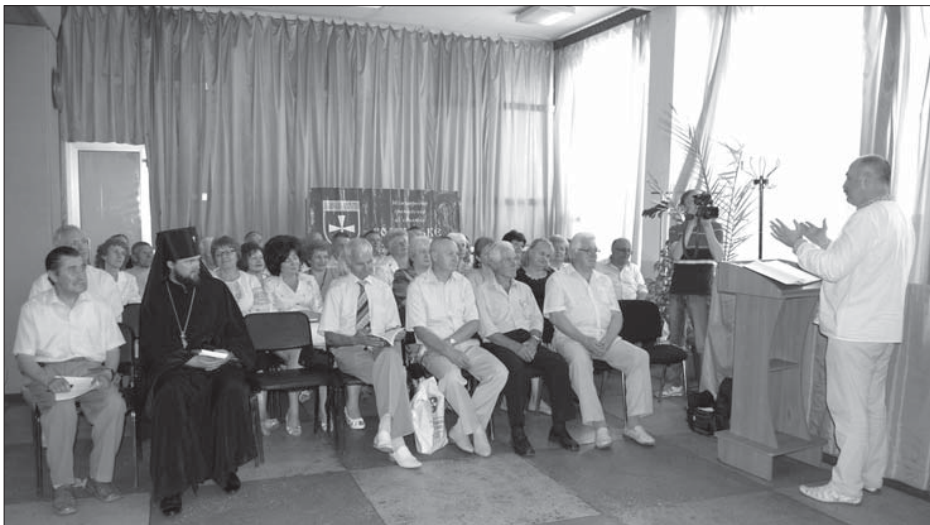
Загальні збори Полтавського обласного осередку МГО “Волинське братство” з нагоди п’ятої річниці створення земляцтва