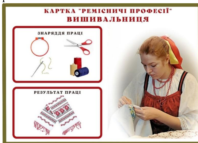
Рис.1 Карточка «Ремісничі професії. Вишивальниця»

Для знайомства дітей з кожною з визначених професій нами було виготовлено картки «Ремісничі професії» (Рис.1), які мали титульну сторону із зображенням митця, його знарядь праці і результату професійної діяльності та зворотною, на якій ми розмістили коротку інформацію про ремісника.