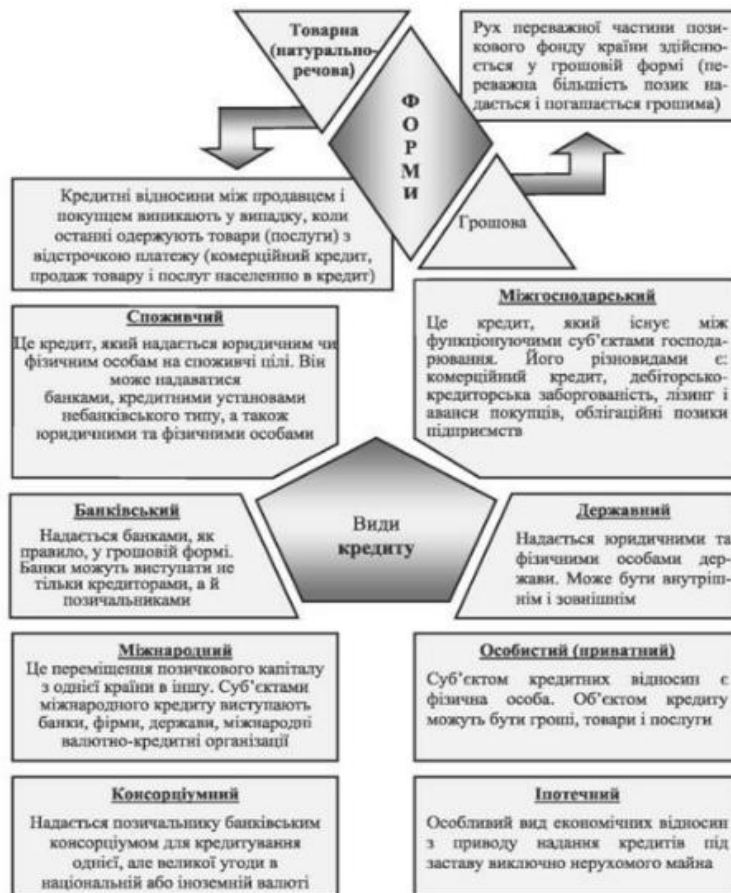
Рис. 1. Форми і види кредиту

Кредит (від лат. credit – он верит) може надаватися як у натуральній , так і у грошовій формі (рис. 1):