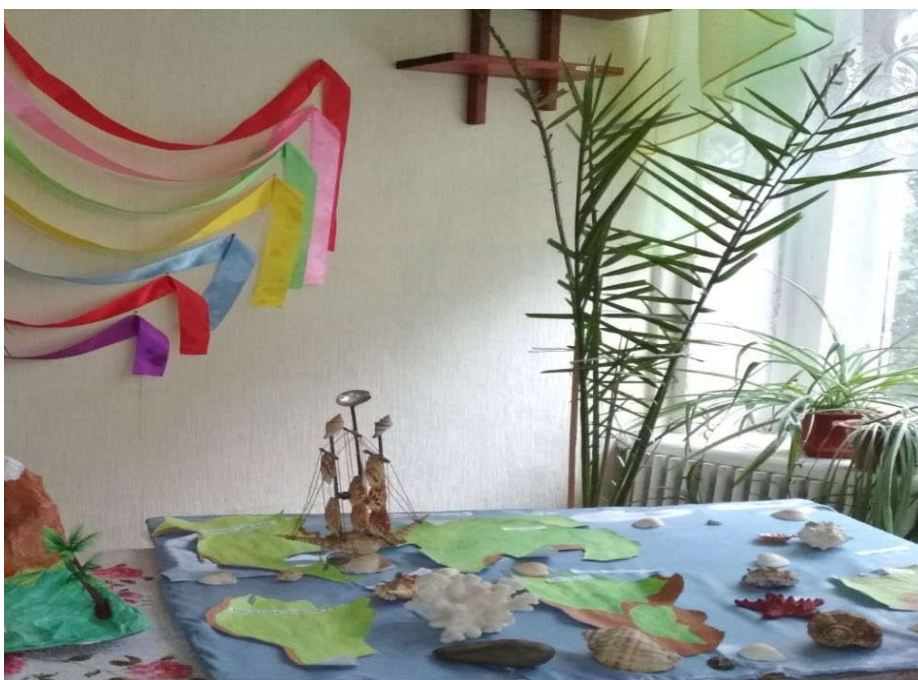
Макет з теми «Перша навколосвітня подорож Ф. Магеллана» зроблений учнями 8 класу

7. Підбиття підсумків гри. Команда, яка дала найбільше правильних відповідей, перемогла.