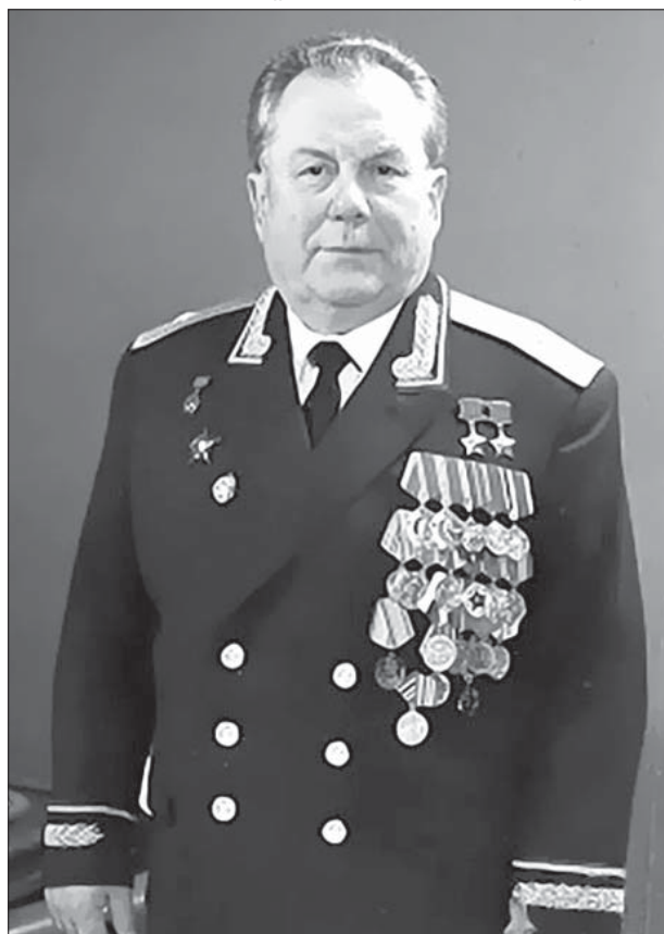
Павло Попович, льотчик-космонавт, двічі Герой Радянського Союзу, Почесний громадянин Полтави

ва в Житомирі. На другий-третій день усі центральні газети області опублікували свої репортажі про врочистості, але в кожній із них, неначе за командою, зізнання Поповича про космічну пригоду з піснею “Дивлюсь я на небо...” “прибрали”. Чи то комусь не сподобалося, що саме українська народна пісня