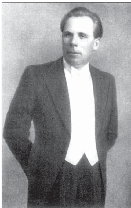
Борис Гмиря, 1948

Зал Житомирського обласного музично-драматичного театру переповнений. Розпочинаються вчистості, далі концерт. Усі з