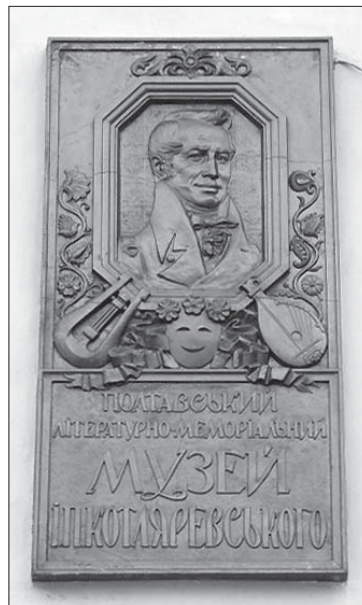
Меморіальна дошка на будинкові музею. Металопластик, лиття. Автор – Є. Пугря. Фото

До мого приходу хтось із працівників раз у місяць мусив підмінити нічного сторожа, з чим я не погодилася і відмовилася виконувати: моєму синові тоді було всього півроку. У зв’язку з цим почалися пошуки ще однієї штатної одиниці. Знайшли! Майже рік ми