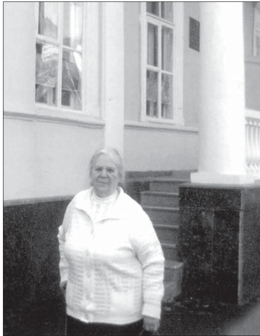
Біля рідного музею під час його 55-річного ювілею. Фото. 27 вересня 2007 р.

Отож нехай віє від музею Котляревського завжди теплом і хай його нові працівники постійно випромінюють симпатію і любов до незабутнього полтавця.