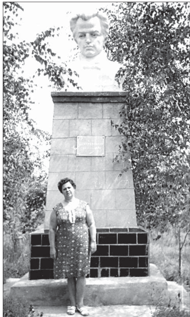
Біла пам'ятника І. П. Котляревському в с. Тахтауловому, Фото. 1973 р.

“Котляревський – це “уосіблення” веселої вдачі народу, його музичного хисту, його різнобічних мистецьких талантів, поєднаних із винятковою скромністю характеру, його прагнення освіти й науки, його військової хоробрості і дипломатичного хисту, глибокої любові до України і до її славного минулого та знедоленого народу, його стремління до волі та справедливості. Іван Котляревський був енциклопедистом-просвітителем, який сказав те перше слово, яке було на початку багатьох