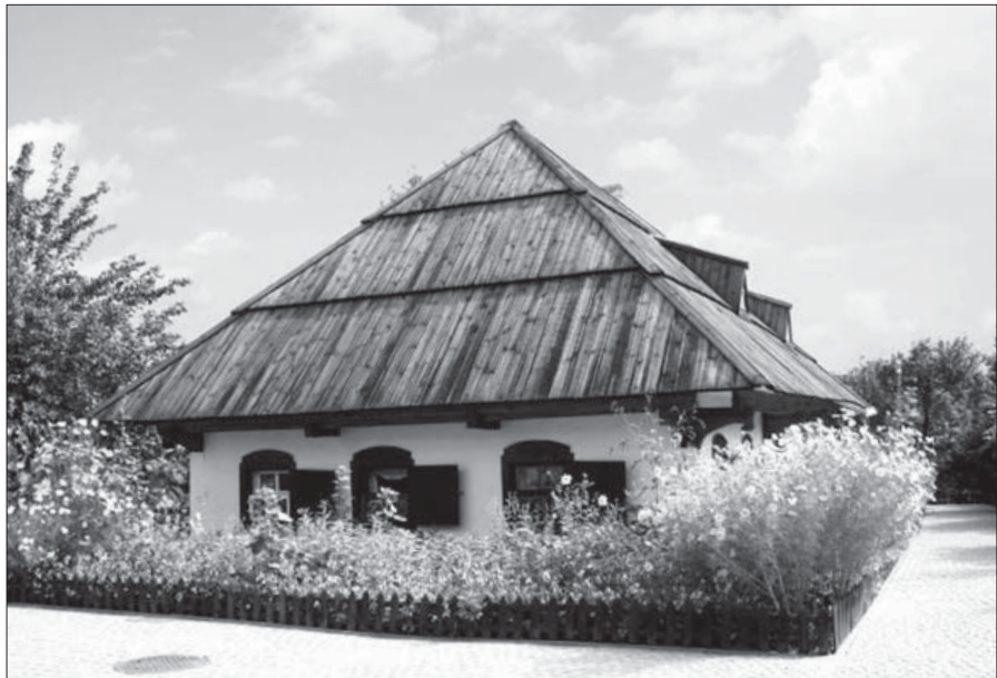
Хата Івана Петровича Котляревського. Фото

За рішенням уряду створили ювілейну комісію, і таки було прийнято рішення про відбудову хати-садиби І. П. Котляревського.