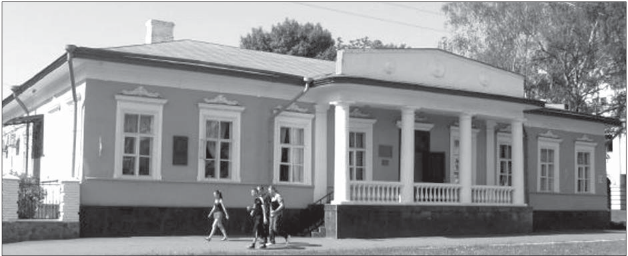
Літературно-меморіальний музей І. П. Котляревського. Фото