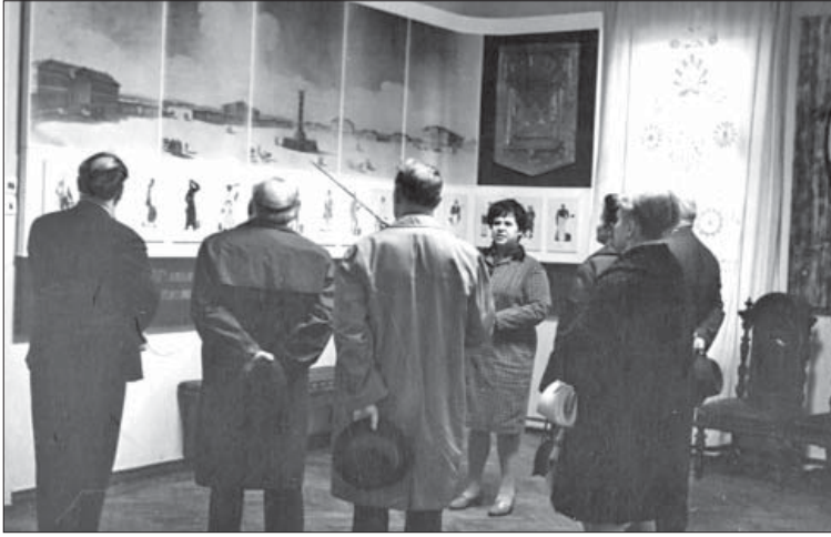
Члени журі Республіканського конкурсу на краще виконання ролі Наталки Полтавки в музеї І. П. Котляревського. Фото. 1969 р.

директор музею. Він був науковим керівником, наставником, спонукав співробітників до пошуків і відкриттів, вважаючи, що музей – це перш за все наукова установа, а вже потім масова, популяризаторська.