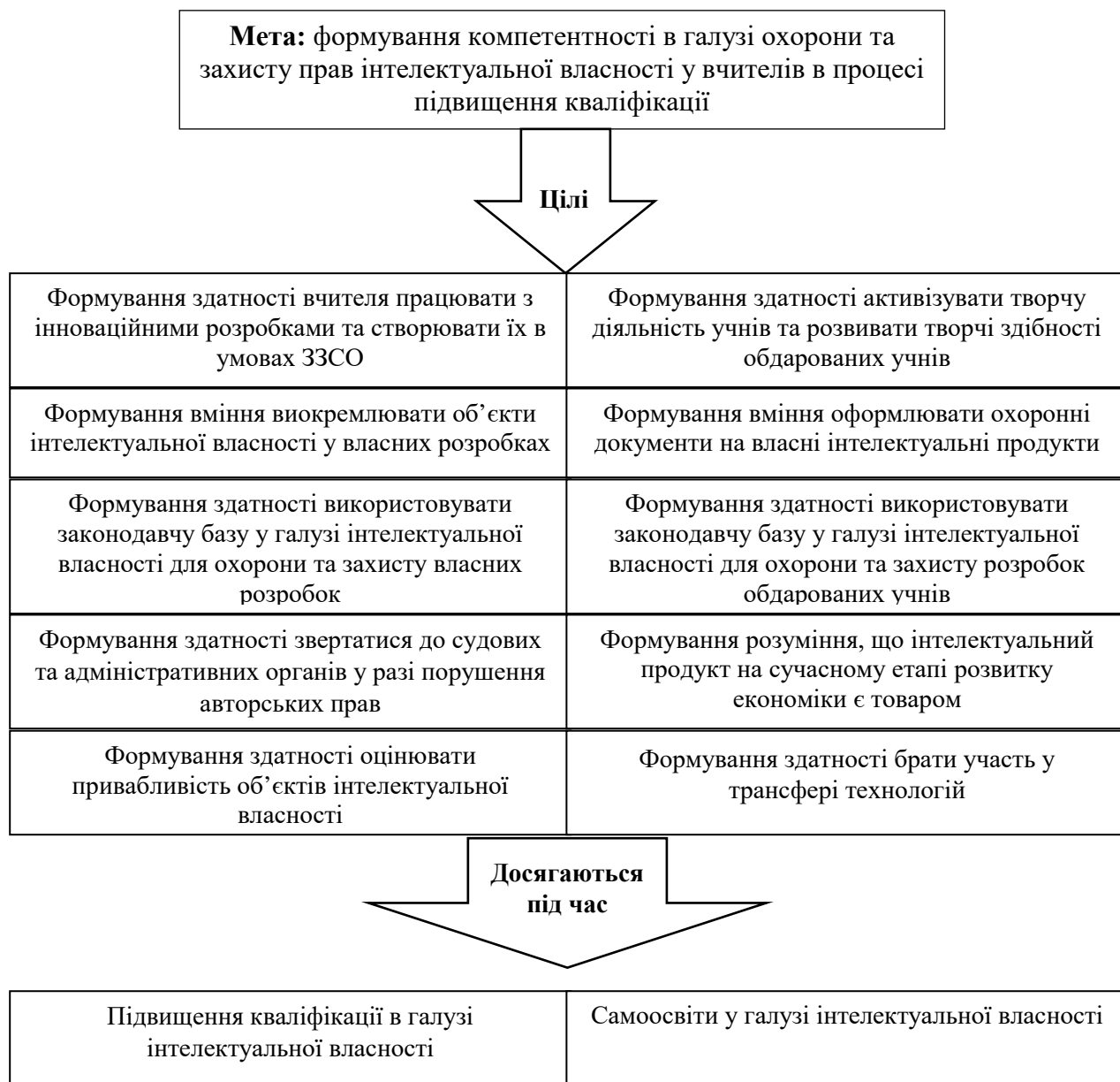
Рис. 2. Сукупність цілей, спрямованих на формування компетентності з охорони та захисту прав інтелектуальної власності вчителів в процесі підвищення кваліфікації

За спрямовуючу мету технології підвищення кваліфікації вчителів в сфері охорони та захисту прав інтелектуальної власності ми виокремили формування компетентності у галузі інтелектуальної власності в процесі підвищення кваліфікації вчителями ЗЗСО. При подальшій деталізації цілей ми визначили конкретні цілі окресленої технології, які необхідно реалізувати в процесі проходження викладачами курсів з підвищення кваліфікації (рис.2).